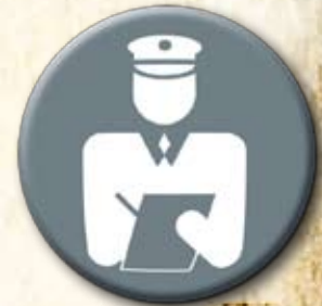
Partido da Segurança Pública