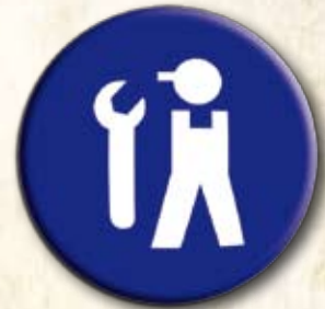
Partido do Emprego