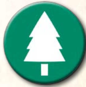
Partido da Natureza