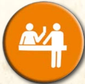
Partido da Defesa do Consumidor