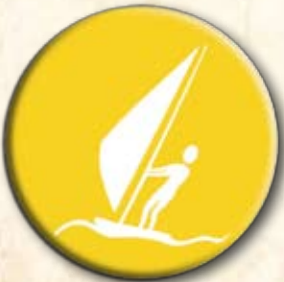
Partido da Juventude