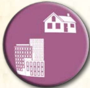
Partido da Habitação