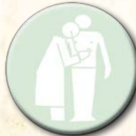
Partido da Saúde