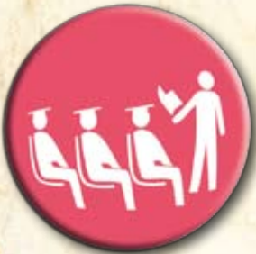
Partido da Educação