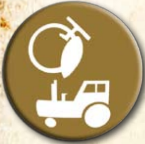
Partido da Agricultura

No Parlamento Jovem os candidatos terão que escolher um Partido para elaborar seus projetos e para se inscrever. Os Partidos são temáticos. O candidato deverá escolher entre 12 Partidos: