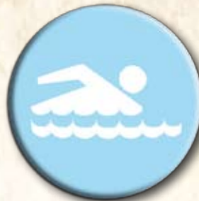
Partido dos Esportes