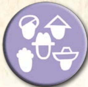
Partido dos Direitos Humanos