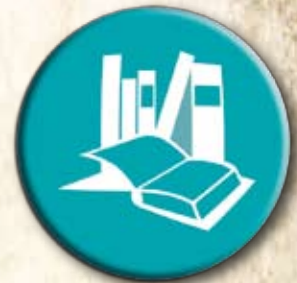
Partido da Cultura