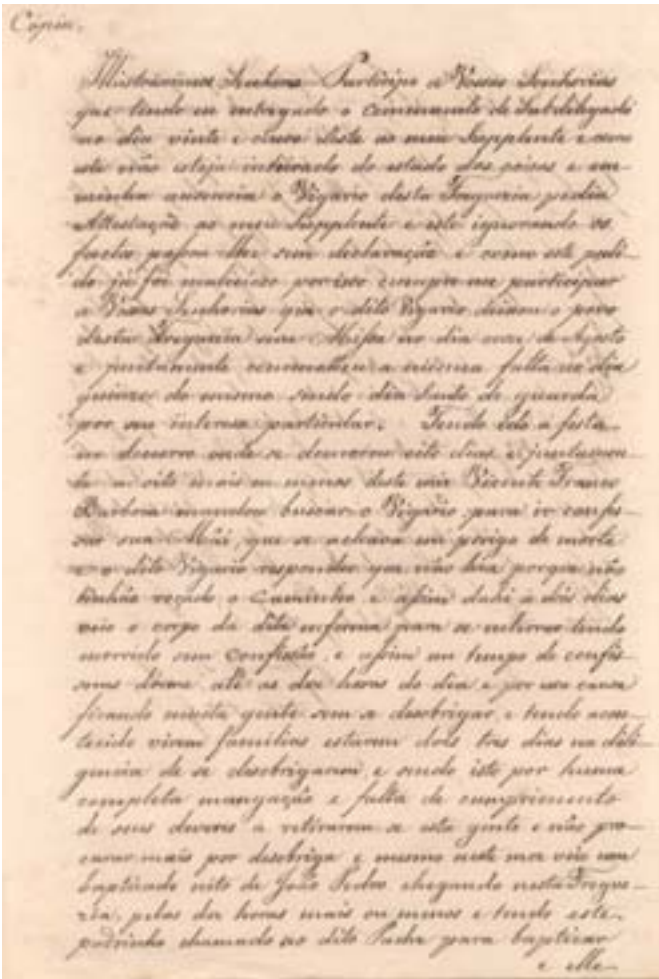
Manuscrito da queixa de Amparo.

logar quando a parte que produzio a testemunha, ou documento, delles desistir. Sendo contraria a deliberação da Assembléa, será adiado o julgamento, remetendo-se o depoimento, ou documento ao Juiz competente para instaurar sobre isso o competente processo, com urgencia, e participar a Assembléa a decisão final. Recebida esta, continuará o julgamento, designando-se dia em que as partes devão comparecer.