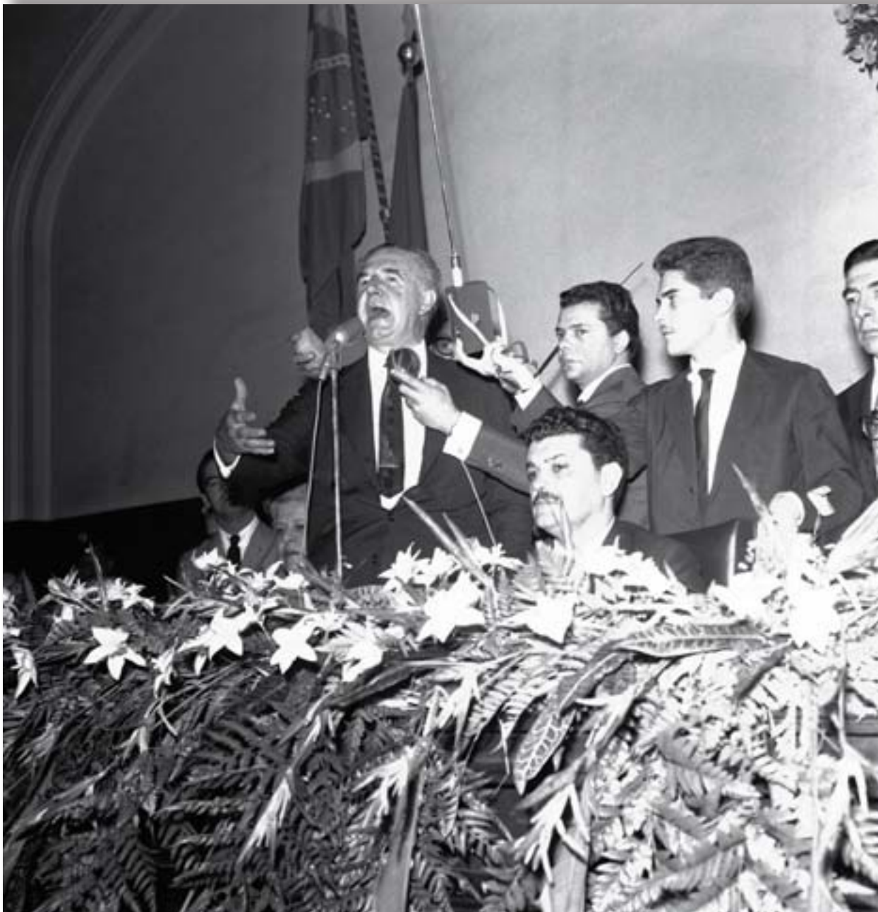
O governador Adhemar de Barros discursa na sessão solene de posse da Mesa da Assembléia, em 14 de Março de 1964.

a estrutura governamental para sua campanha à Presidência, acusou-o de criar cargos bem remunerados para beneficiar amigos e correligionários e de fazer obras “desnecessárias, improdutivas e voluptuárias”, o que estaria causando uma orgia financeira no estado 7 .