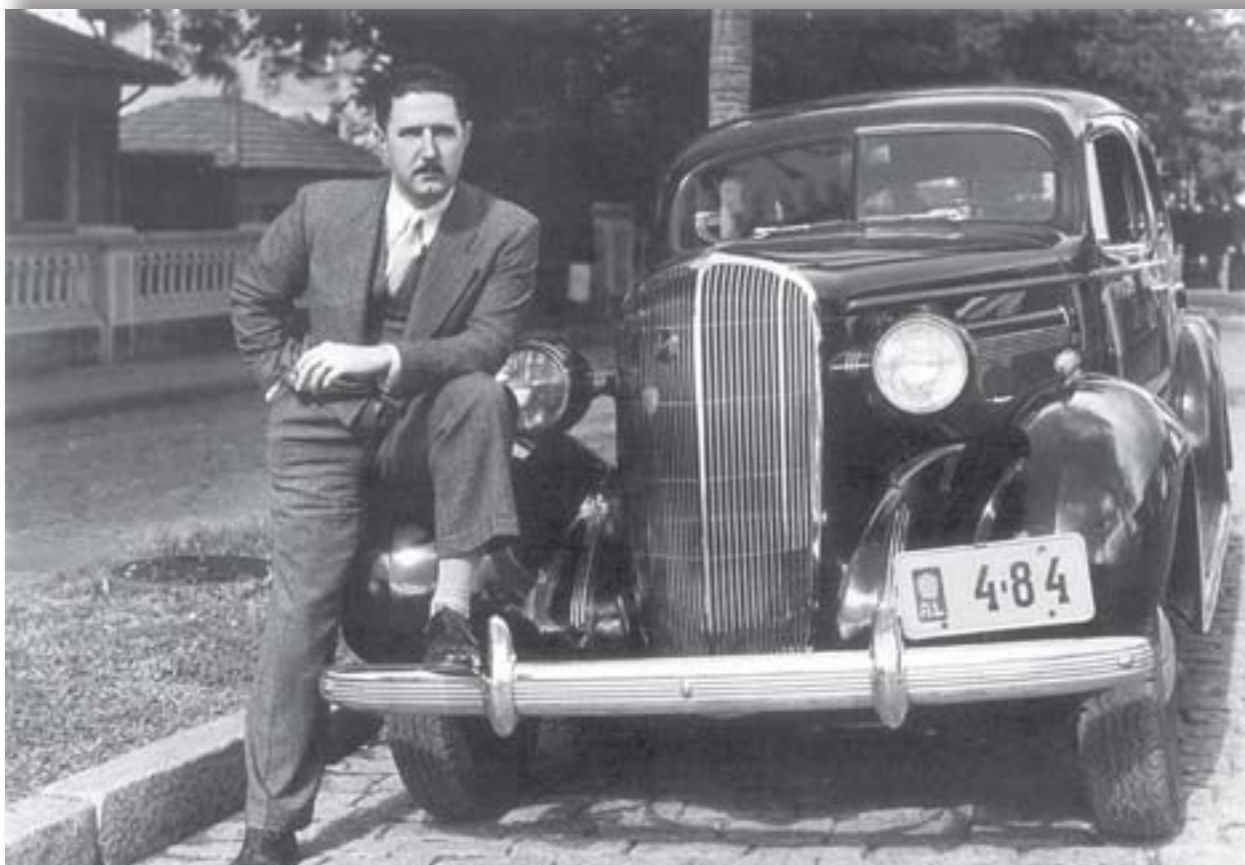
O Deputado Adhemar de Barros posa ao lado do carro oficial da Assembléia.

A busca da autonomia de São Paulo não foi o único objetivo da revolução de 1932. O movimento, prosseguiu o Deputado Adhemar de Barros, também procurou libertar o Brasil de uma política pautada pela desorientação, insinceridade e mau uso do dinheiro público. Nesse sentido, fez uma série de acusações contra a administração de Armando de Salles Oliveira. Dentre outras denúncias, afirmou que Salles Oliveira estava utilizando