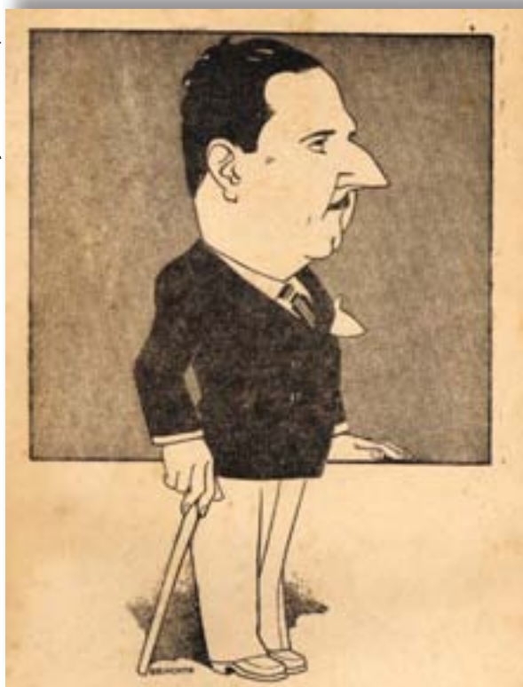
Adhemar de Barros caricaturado por Belmonte em 1941.