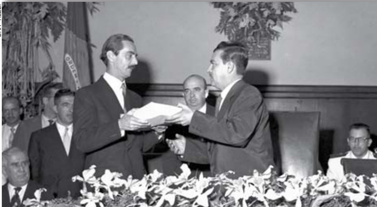
Governador Jânio Quadros entrega a Mensagem anual ao presidente da Assembléia Legislativa, deputado Ruy de Almeida Barbosa, em sessão solene de 14 de Março de 1956 .