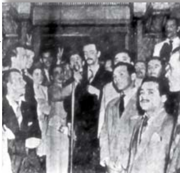
Em 1951 o deputado Jânio Quadros presente em assembléia do Sindicato dos Bancários da Capital para apoiar a greve da categoria.

constante e ininterruptamente. Humanos como ninguém! Quase personificam a humanidade." 21