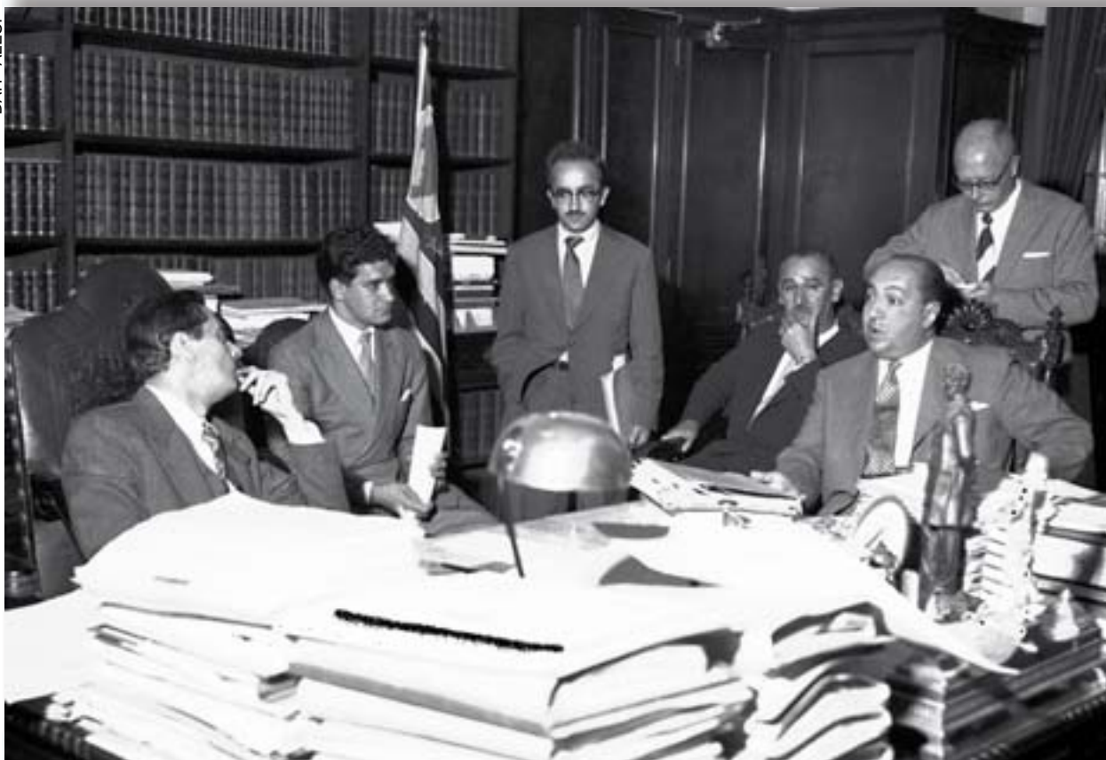
Governador Jânio Quadros recebe em seu gabinete no Palácio dos Campos Elíseos comissão de deputados paulistas para tratar do problema dos morros de Santos, em 16 de Outubro de 1956.

em vários setores da administração pública.