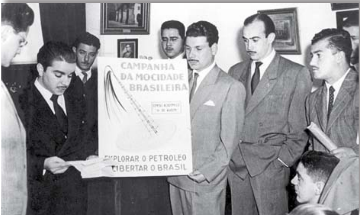
O Centro Acadêmico XI de Agosto da Faculdade de Direito de São Paulo lança campanha pela exploração do petróleo, em 27 de agosto de 1947.