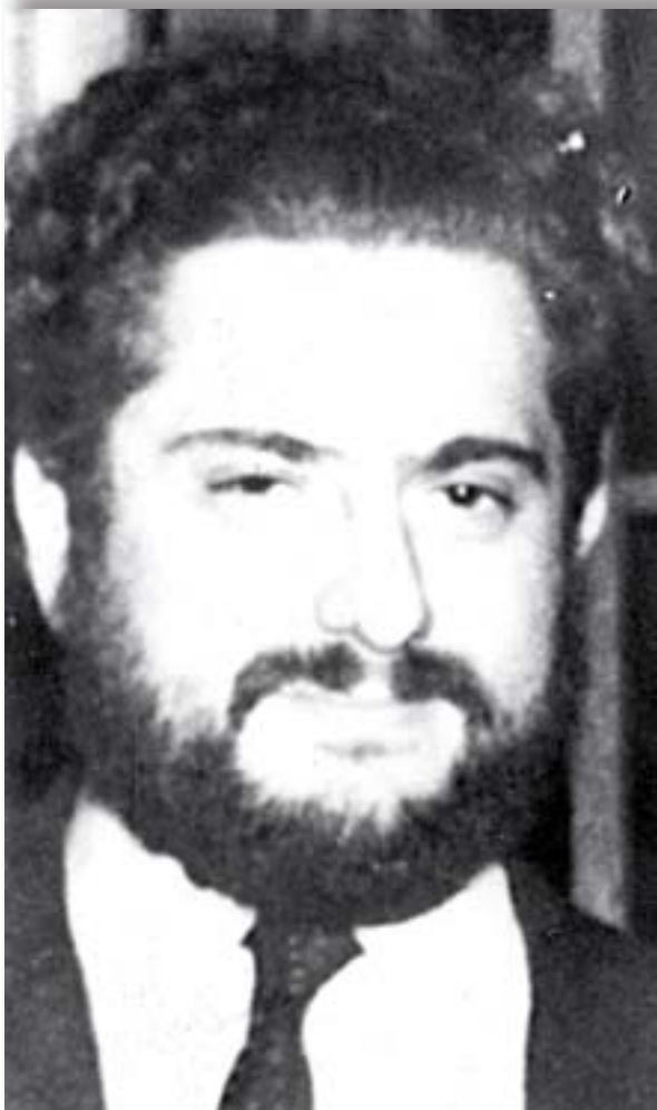
Mario Schenberg, em junho de 1948, detido pela polícia após a cassação de seu mandato de deputado.

denotam sua radicalidade constitutiva. Pois quem quiser entender a questão do petróleo no mundo e não apenas no Brasil, terá sua visão aguçada pela leitura de seus discursos, e terá uma visão retrospectiva que se projeta, heurísticamente, para o futuro. Logo, o aspecto que dá projeção duradoura à política do petróleo de Mario Schenberg no Parlamento Paulista resulta de um compromisso ético-político, de denúncia da passividade e subserviência do Governo Dutra e de crítica ao domínio imperialista. A tessitura fina de Mario Schenberg permitia a audiência à época (e aos leitores de ontem, de hoje e de amanhã) penetrar aos poucos na densa matéria social – haja vista a discussão do dilema de Carlos Lacerda, a saber, a entrega da exploração de petróleo aos ianques ou nada fazer –, para tocar fundo, por fim, nas raízes mesmas de debilidade da redemocratização de 1945, sem que para tal viagem ele seja conduzido por um tom irracionalmente raivoso de denúncia, que daria aos discursos uma feição particular, datada e localizada. Nesses termos, qual será o impacto dos discursos de Mario Schenberg? 6