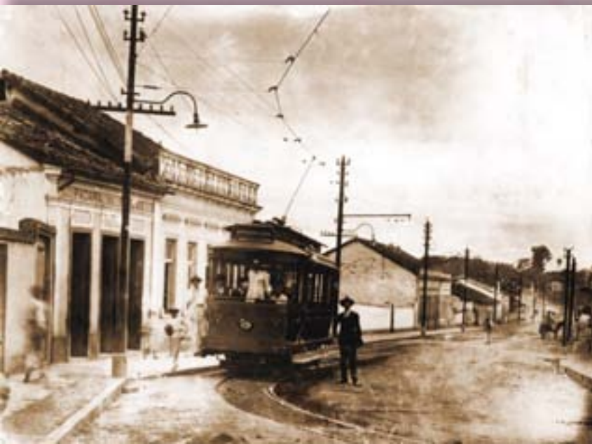
Rua de Aparecida.