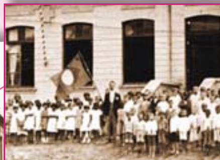
Grupo Escolar de Aparecida.