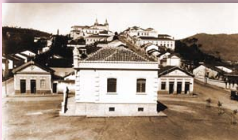
Posto Policial e Delegacia.