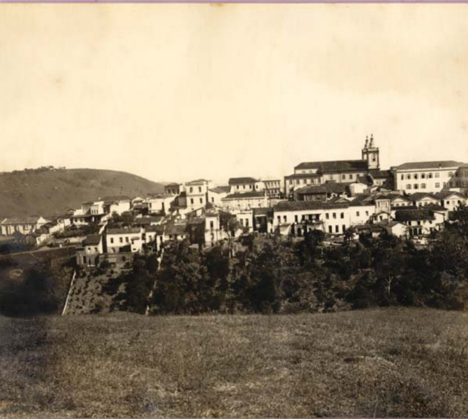
— Vista panoramica