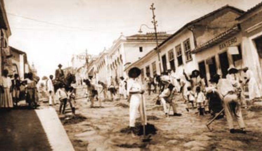
Os moradores da Rua Monte Carmelo capinando, fazendo a remoção de lixo e capim. A Rua Monte Carmelo foi a primeira rua de Aparecida.