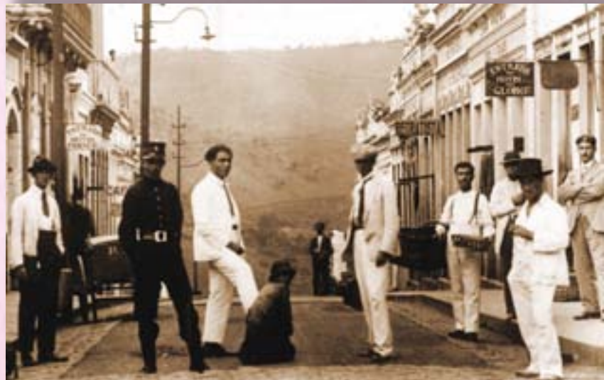
Rua Major Martiniano.