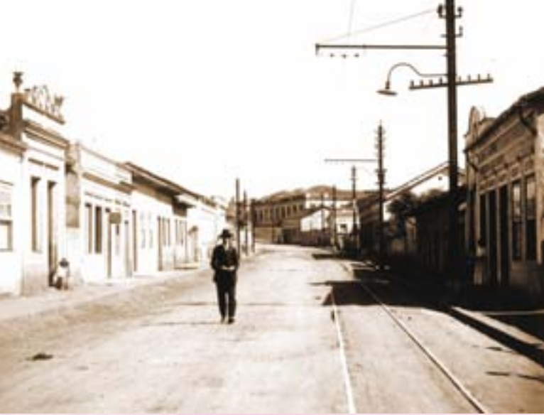
Rua de Aparecida.

Neste ofício do Governador de São Paulo ressalta a denominação popular de Aparecida do Norte, o qual vem da época em que a linha férrea que passava por Aparecida era chamada de a "do Norte" (Estrada de Ferro do Norte ou Estrada de Ferro São Paulo - Rio de Janeiro).