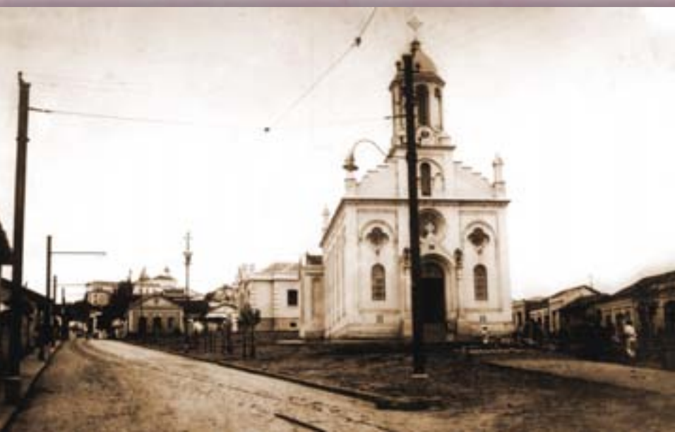
Igreja São Benedito.