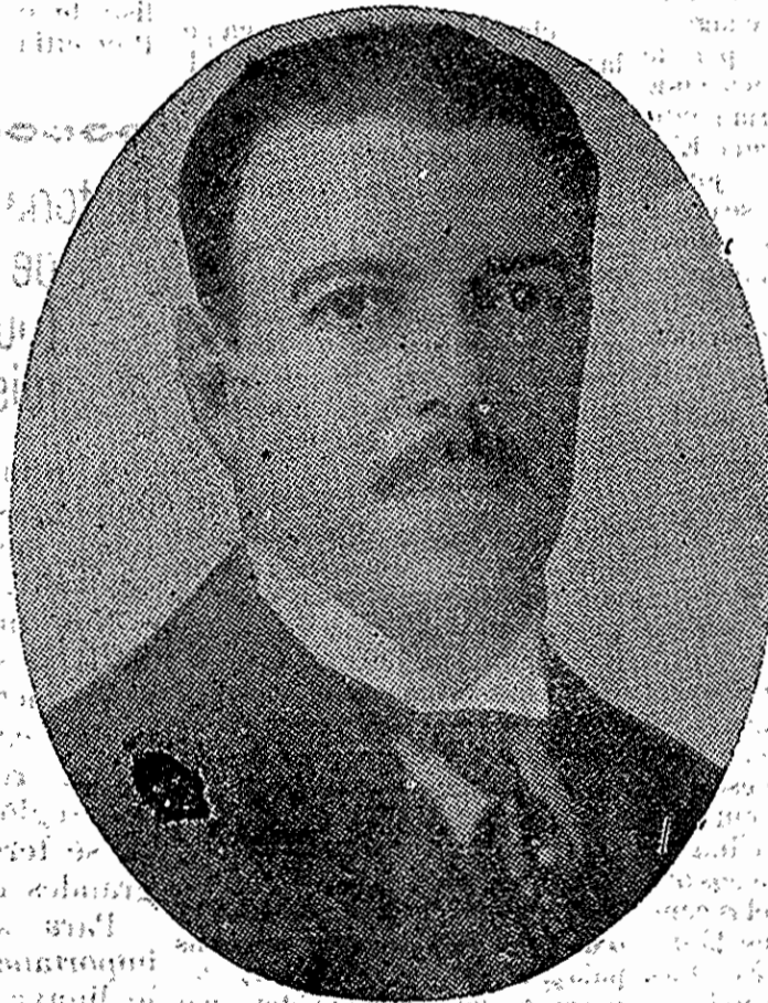
Dr. Julio Prestes de Albuquerque

Localisada no massisso do espigão “Peixe-Feio”, com um clima saluberrimo, optimas aguas, cercadas por terras já judicialmente divididas e cortadas em lotes que variam de 10 a 500 alqueires, cuja iberdade recebeu a consagração dos mais experimen-