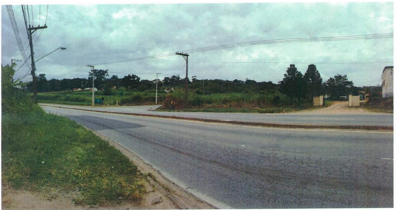
Figura 3 - Foto Panorâmica do Local para pedido da Rotatória ou Alça de Acesso – Saída para Estrada Junichi Shigueno