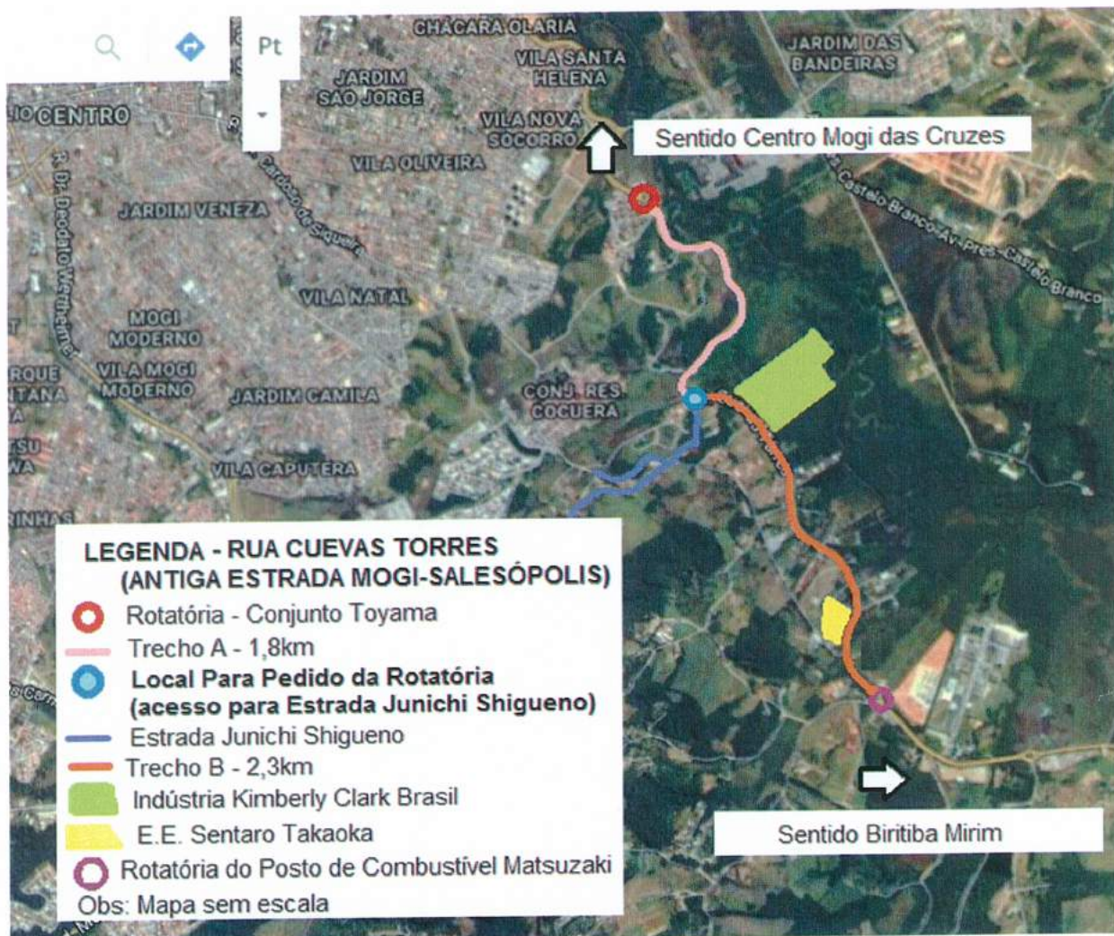
Figura 1: Foto Aérea Esquemática da Região

A Nova Rotatória requerida daria acesso à Estrada Junichi Shigueno (Figura 2 e 3), facilitando a ida ao trecho do Cemitério Parque das Oliveiras e à Estrada Mogi-Bertioga, próximo à Vila da Prata. Além disso, atenderiam os inúmeros pedidos dos alunos e funcionários da E.E. Sentaro Takaoka e dos moradores e trabalhadores da região do Bairro do Cocuera, Biritiba Mirim e Salesópolis, criando um novo acesso ao Centro da cidade de Mogi das Cruzes e demais locais. Com isto, desviaria um pouco o tráfego da região próxima ao Shopping de Mogi das Cruzes e a UMC (Universidade de Mogi das Cruzes), aliviando um pouco o congestionamento nos horários de pico.