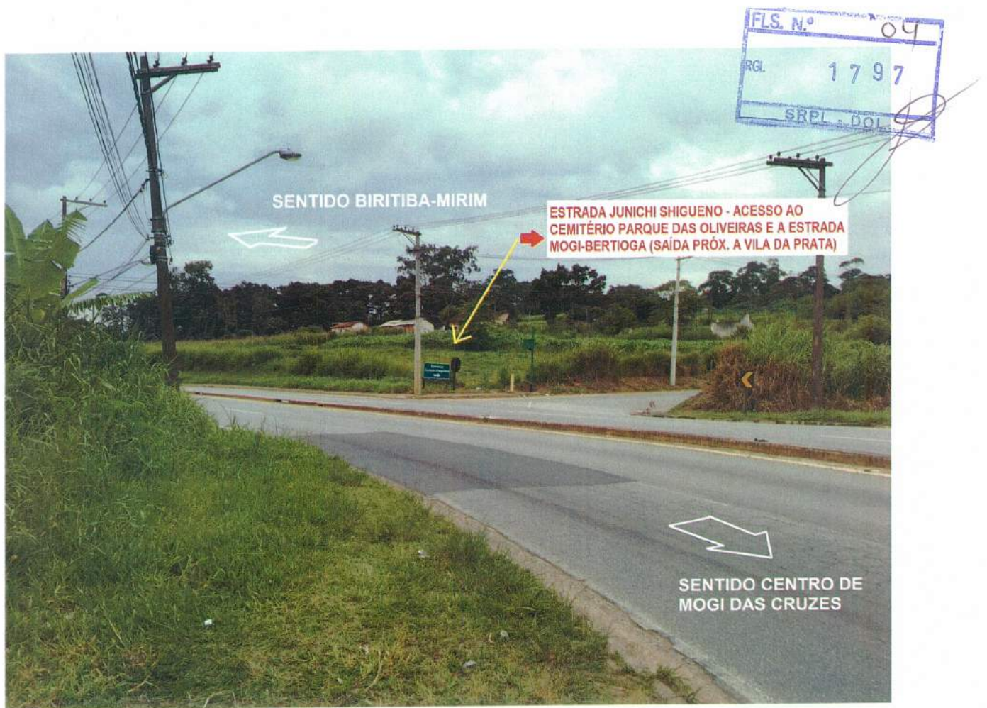
Figura 2 - Foto do Local para pedido da Rotatória ou Alça de Acesso – Saída para Estrada Junichi Shigueno