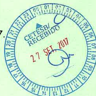
WALDIR AGNELLO Chefe de Gabinete

Chefia de Gabinete, em 25 de setembro de 2017.