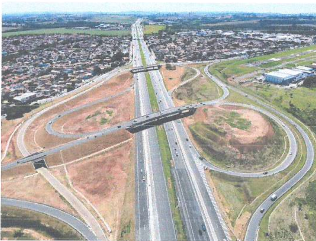
Imagem: complexo viário localizado na região dos Amarais, na altura do km 143+000m da Rodovia Dom Pedro - SP 065, em Campinas, totalmente remodelado em 2020.

Diante do exposto, em reconhecimento ao relevante histórico Dom Luciano Mendes de Almeida, solicitamos o apoio dos Nobres Pares a fim de dar o honrado nome ao complexo viário acima mencionado.