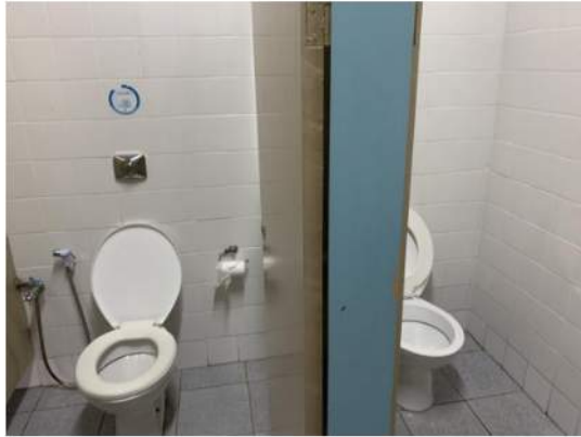
Esgoto - Louças Sanitárias