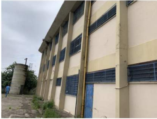
Cobertura - Viga Calha