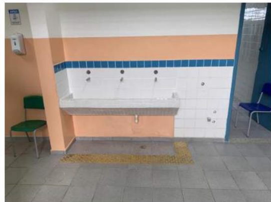
Hidráulica - Bebedouros / Lavatório