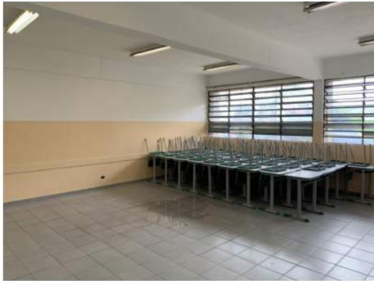
Vigas, Pilares e Lajes