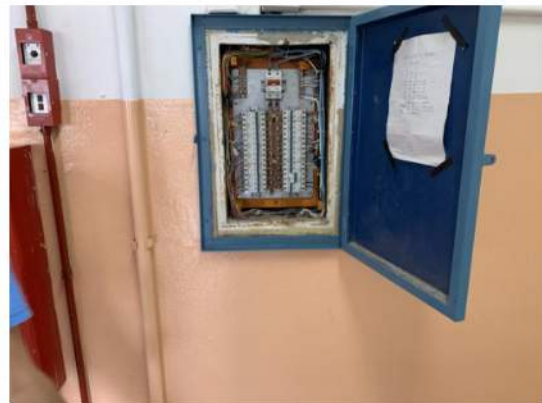
Elétrica - Quadro de Distribuição