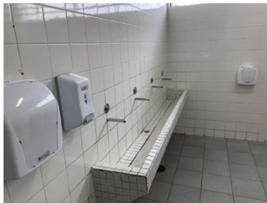
Sanitário de Alunos