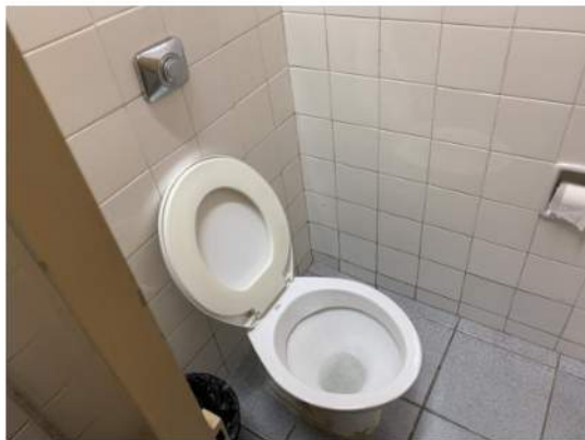
Esgoto - Louças Sanitárias