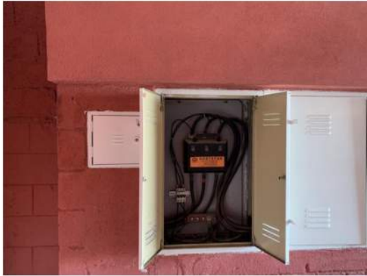
Elétrica - Quadro Geral