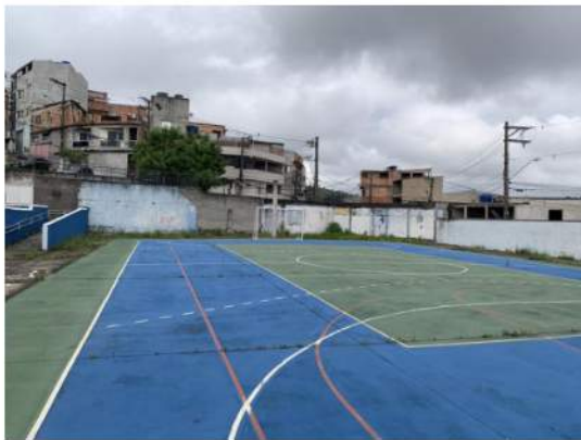
Quadra de Esportes Descoberta