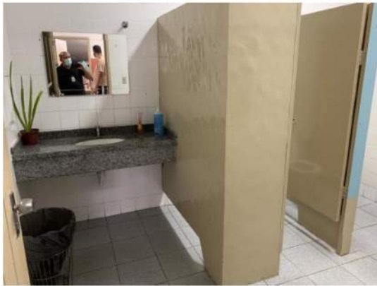
Sanitário de Funcionários