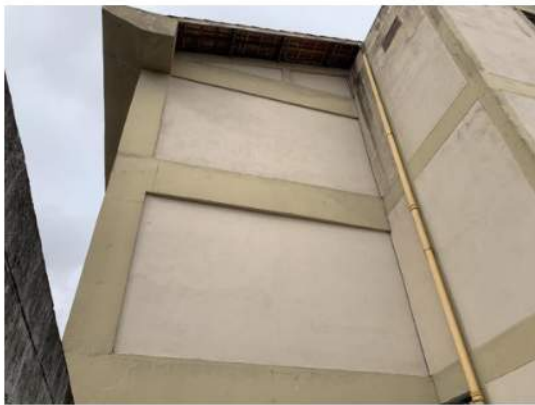
Cobertura - Telhas