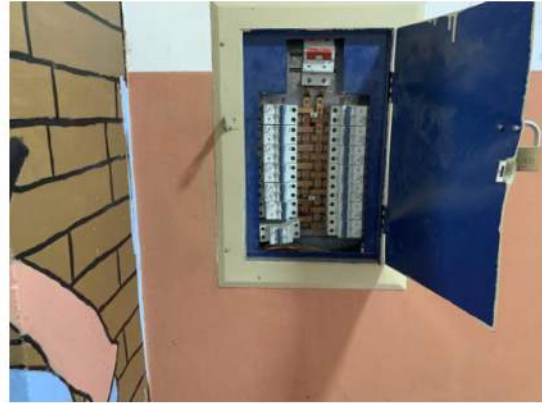
Elétrica - Quadro de Distribuição