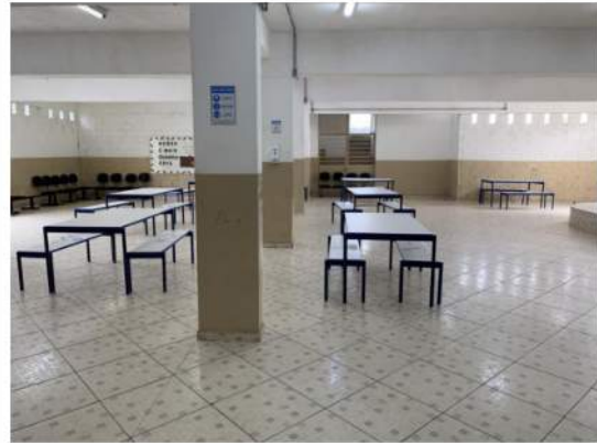
Vigas, Pilares e Lajes