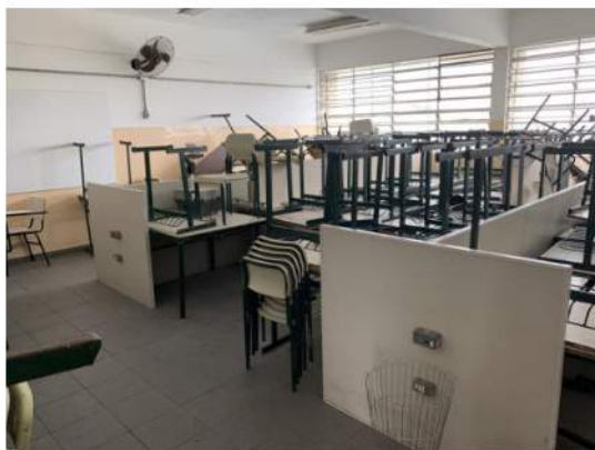
Sala de Informática