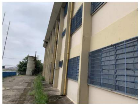
Cobertura - Descidas de AP aparentes