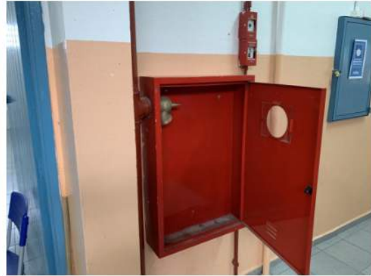
Hidrantes - Tubulação de Incêndio