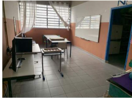
Sala de Recursos