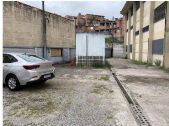
Canaletas de AP