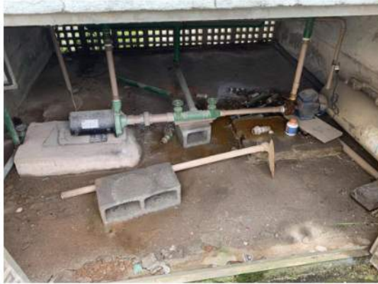
Hidráulica - Bombas