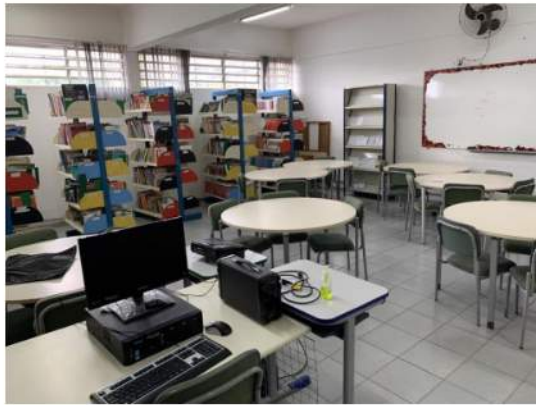
Sala de Leitura