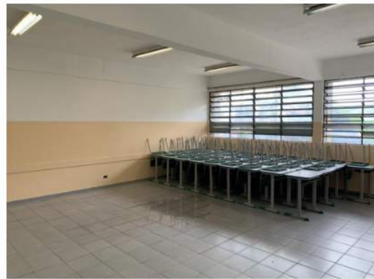
Cobertura - Laje de Cobertura