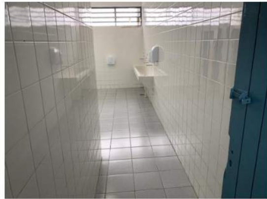
Sanitário de Alunos