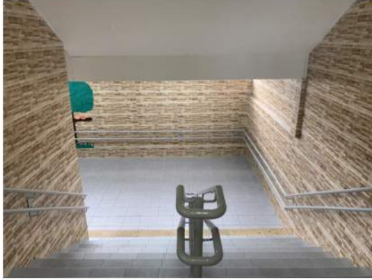
Patamares e Escadas