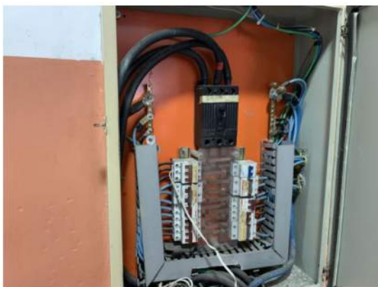
Elétrica - Quadro de Distribuição