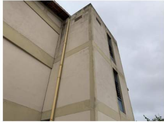
Cobertura - Descidas de AP aparentes