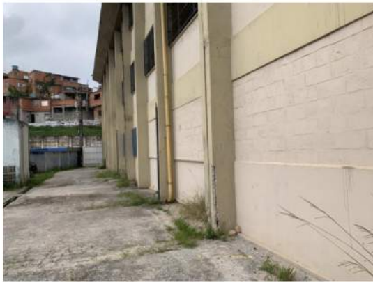
Fachada - Lateral