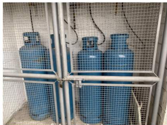
Abrigo de Gás