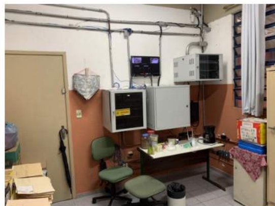
Elétrica - Instalações Aparentes