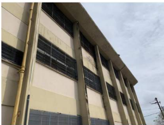
Cobertura - Viga Calha