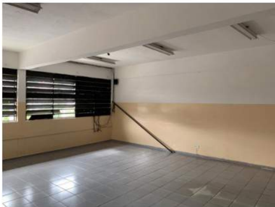
Elétrica - Aparelhos de Iluminação