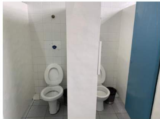
Esgoto - Louças Sanitárias