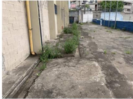
Canaletas de AP