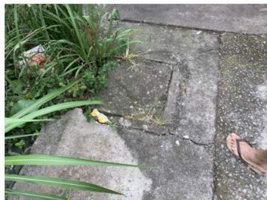
Esgoto - Caixa de Inspeção