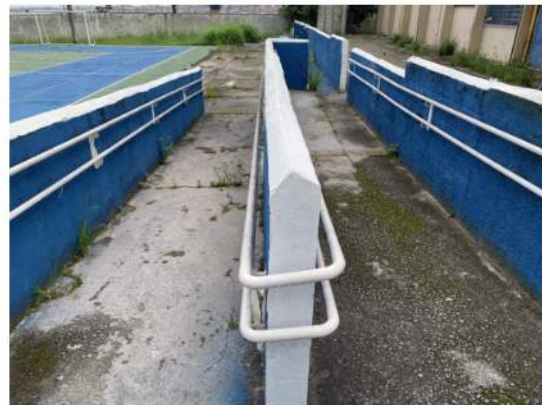
Patamares e Rampas