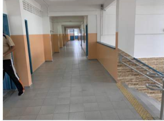
Alvenarias e Lajes