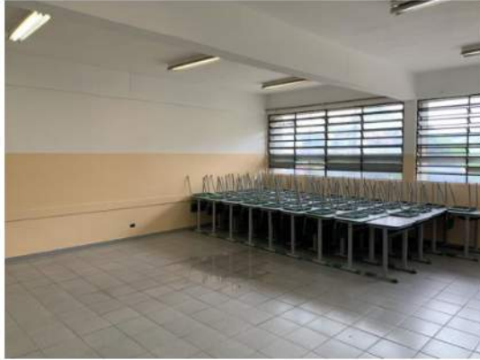
Elétrica - Aparelhos de Iluminação