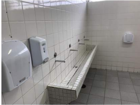
Hidráulica - Torneiras