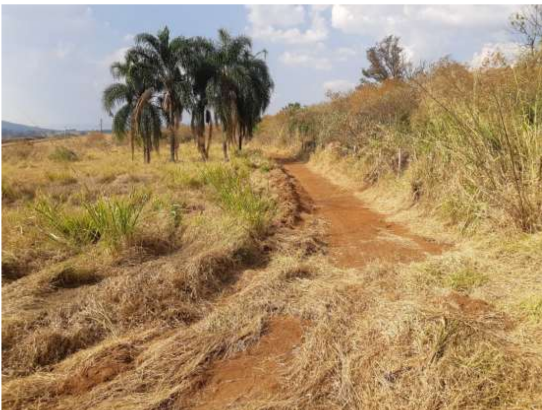
Figura 4 - Imagem do terreno obtida em 17/08/2021.