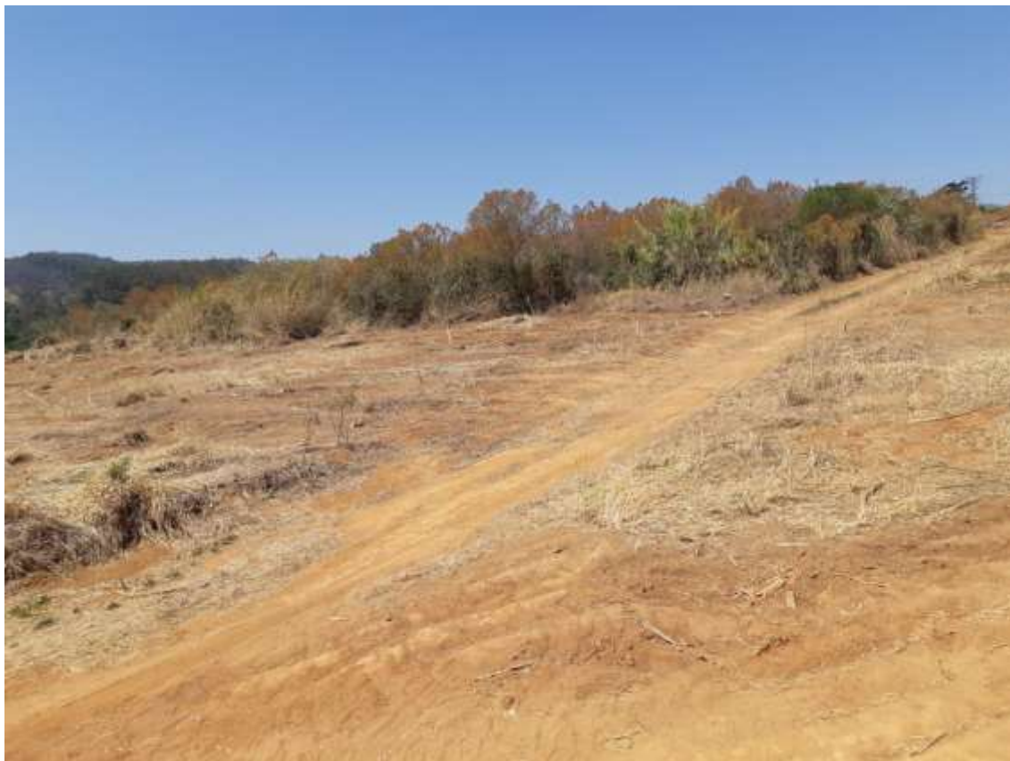
Figura 3 - Remanescente de cafezal e vegetação pioneira, com destaque para árvores isoladas preservadas.