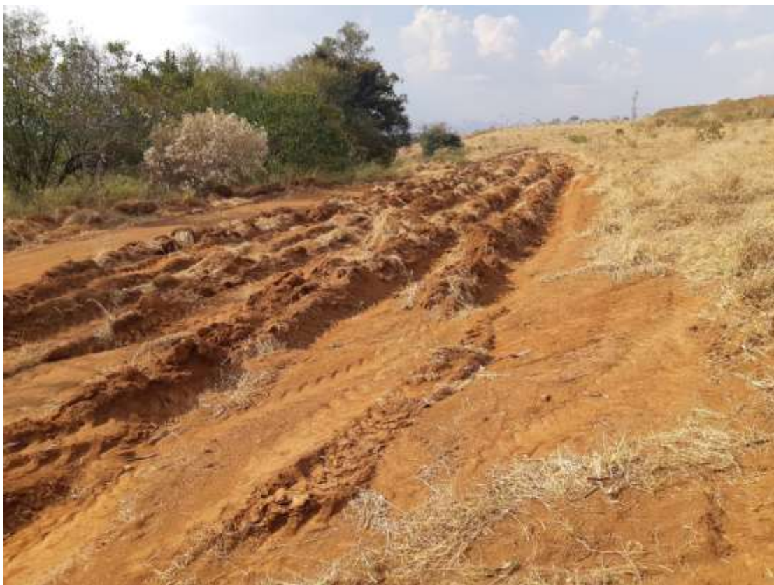
Figura 2 - Imagem do terreno obtida em 17/08/2021.