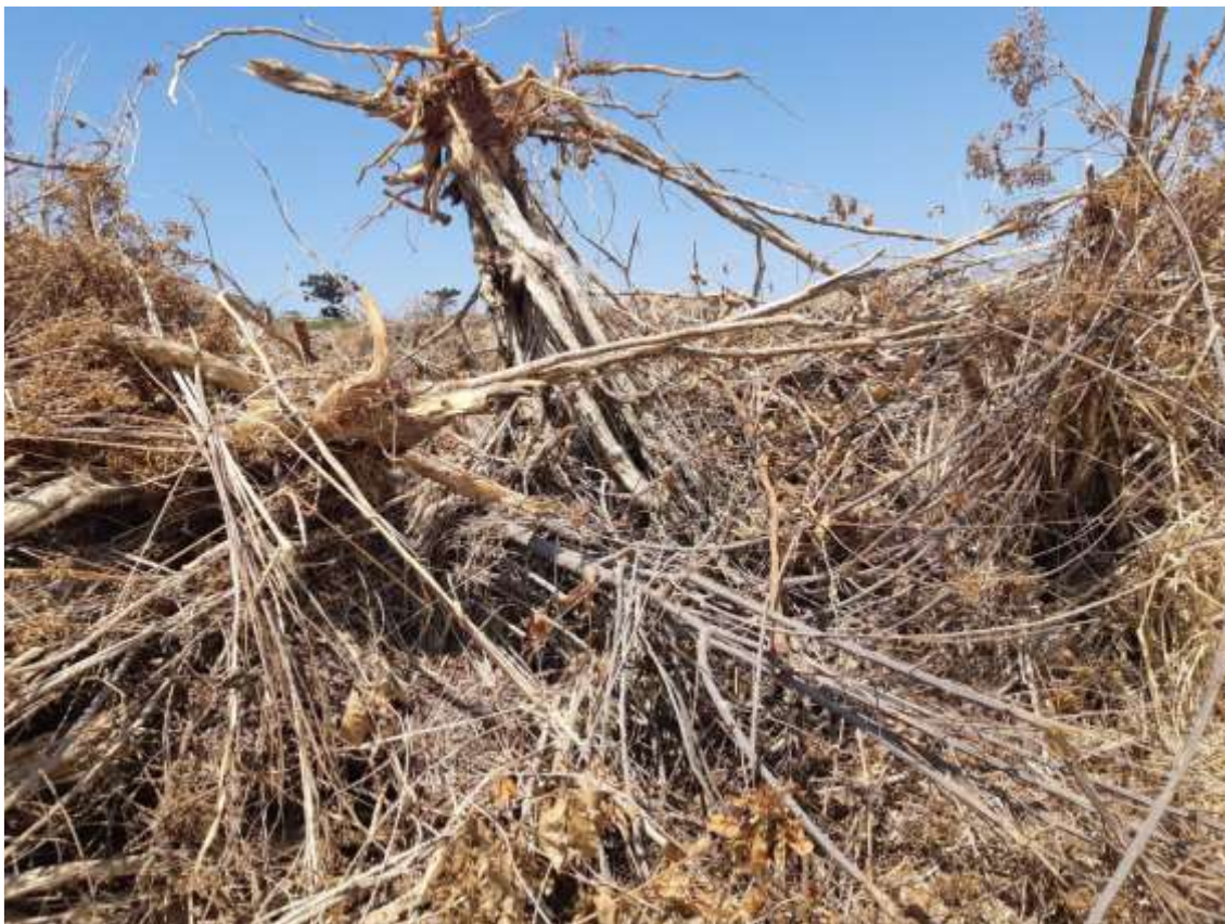
Figura 7 - Vegetação enleirada no local, após o arranquio parcial do cafezal.