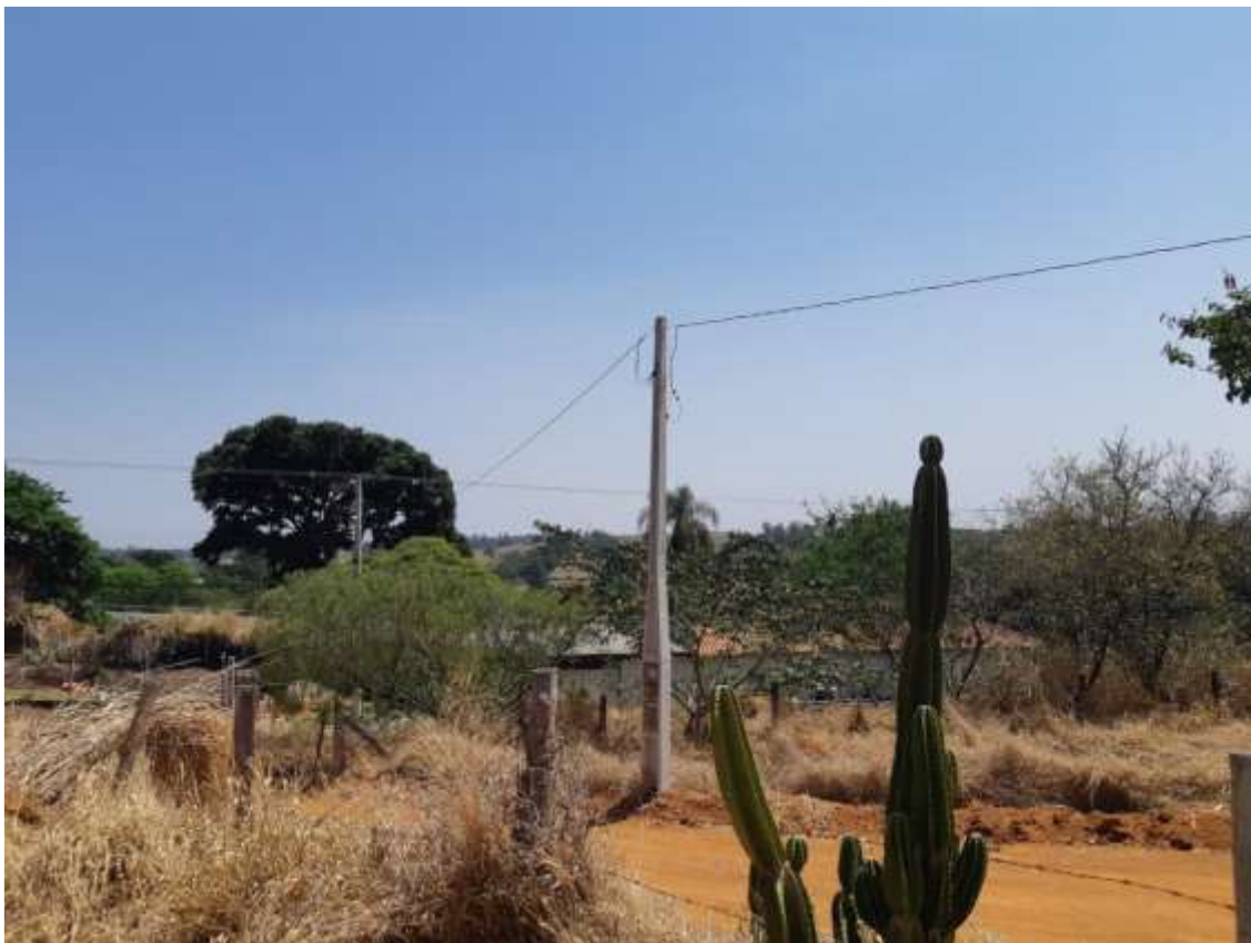
Figura 9 - Padrão de entrada de energia e fiação ligada à torre de transmissão de dados.