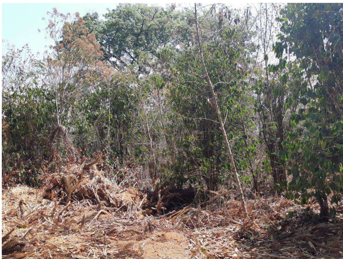
Figura 6 - Remanescente de cafezal e vegetação pioneira.