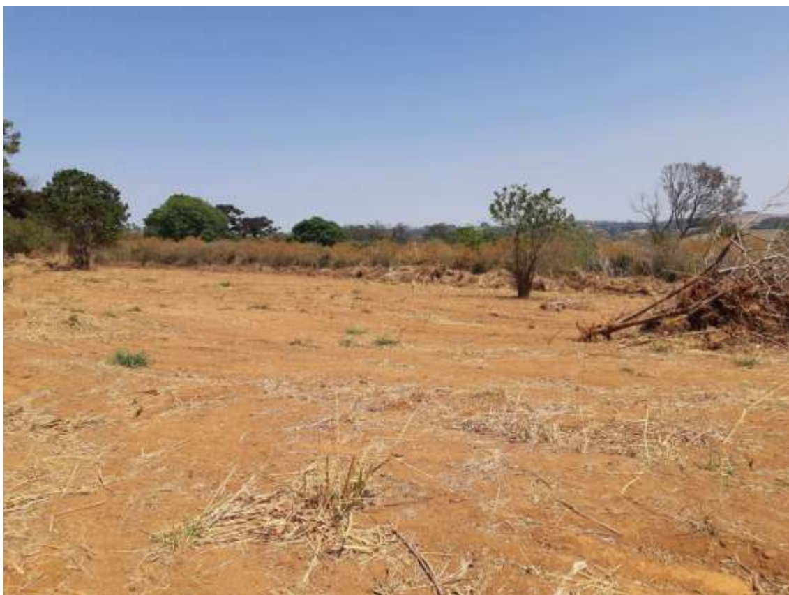
Figura 4 - Remanescente de cafezal e vegetação pioneira, com destaque para árvores isoladas preservadas.