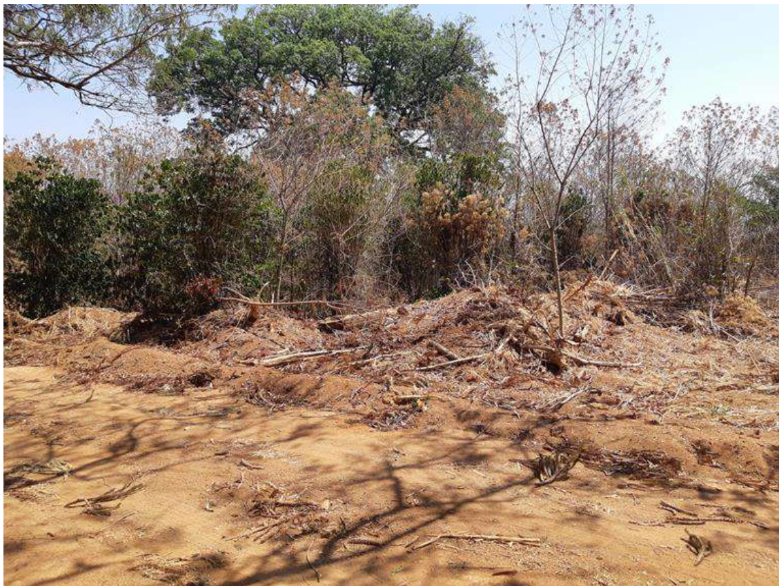
Figura 5 - Remanescente de cafezal e vegetação pioneira.