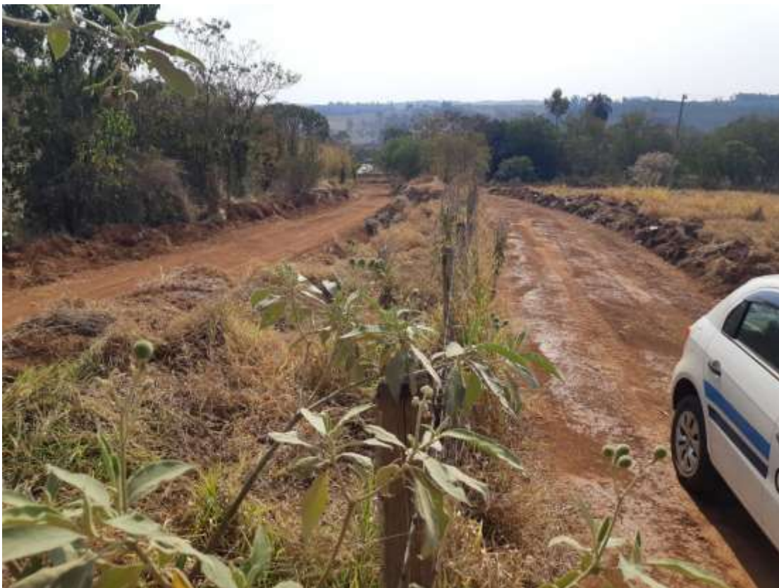
Figura 3 - Imagem do terreno obtida em 17/08/2021.