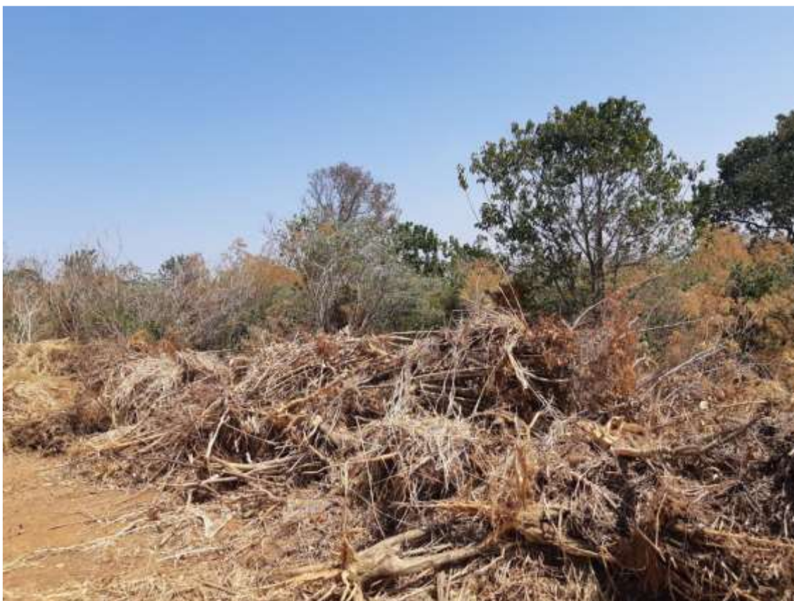
Figura 8 - Vegetação enleirada no local, após o arranquio parcial do cafezal.