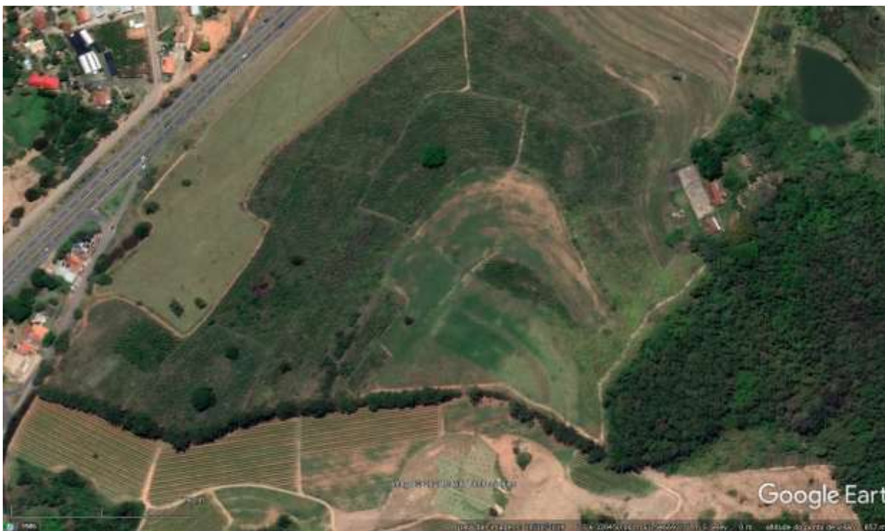
Figura 1 – Imagem de 10/10/2019: Cafezal ainda limpo