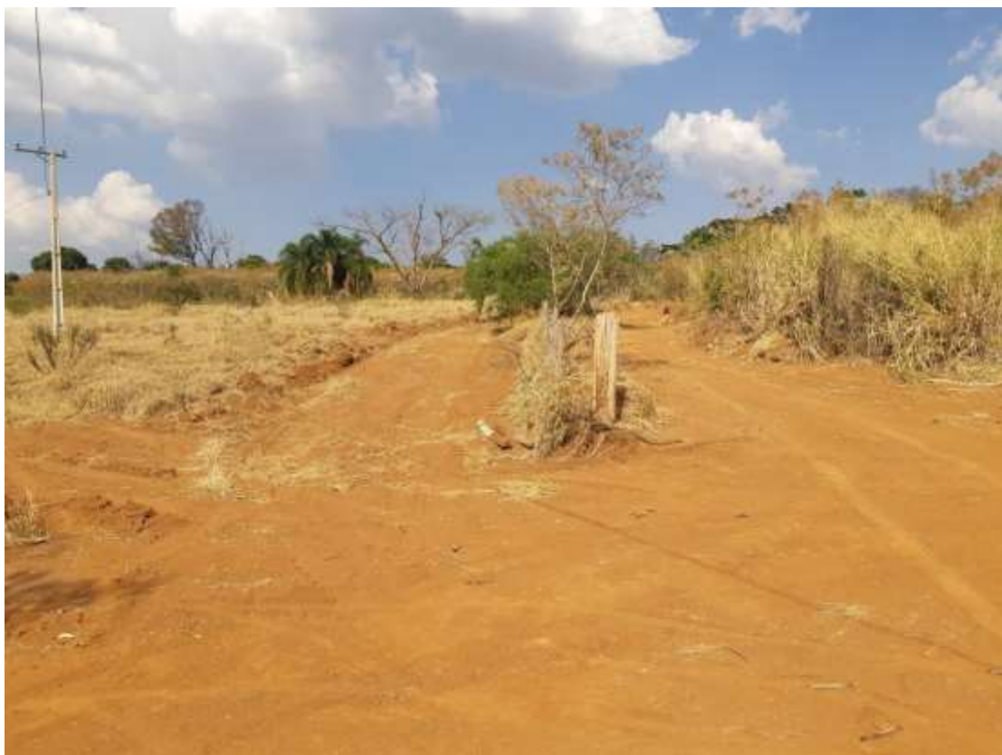
Figura 1 - Imagem do terreno obtida em 17/08/2021.