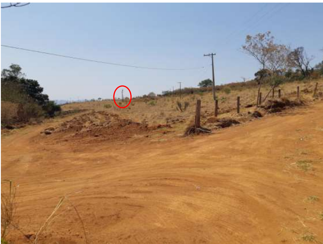
Figura 10 - Fiação de energia ligada à torre de transmissão de dados (em destaque).