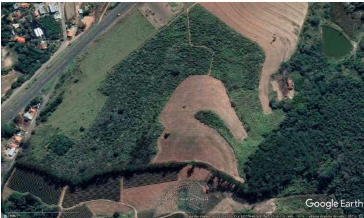
Figura 2 - Imagem de 25/06/2021: Cafezal com vegetação em estágio pioneiro e com vegetação exótica (predomínio da espécie “Leucena”)