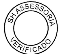
FLAVIO AUGUSTO AYRES AMARY Secretário de Estado da Habitação

À disposição para eventuais esclarecimentos adicionais, na oportunidade reitero a Vossa Excelência protestos de distinta consideração.