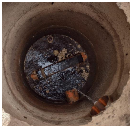
Foto 4: Rede coletora de esgoto funcionando normalmente verificada pelo poço de visita