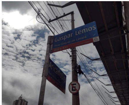
Foto 1: Placas da Rua Gaspar de Lemos esquina com a Av. Aricanduva

Informamos também que as redes coletoras de esgoto existentes na rua estão funcionando normalmente como pode ser visto nas fotos.