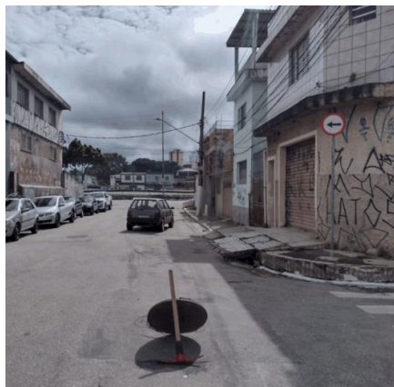
Foto 3: Inspeção na rede coletora de esgoto na Rua Gaspar de Melo