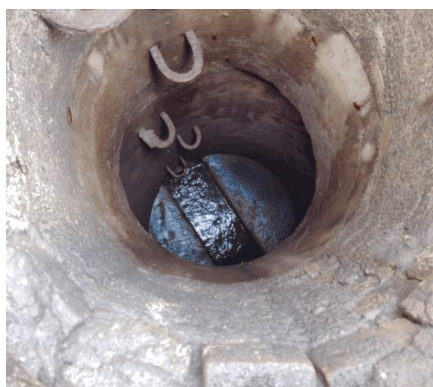
Foto 5: Rede coletora de esgoto funcionando normalmente verificada pelo poço de visita