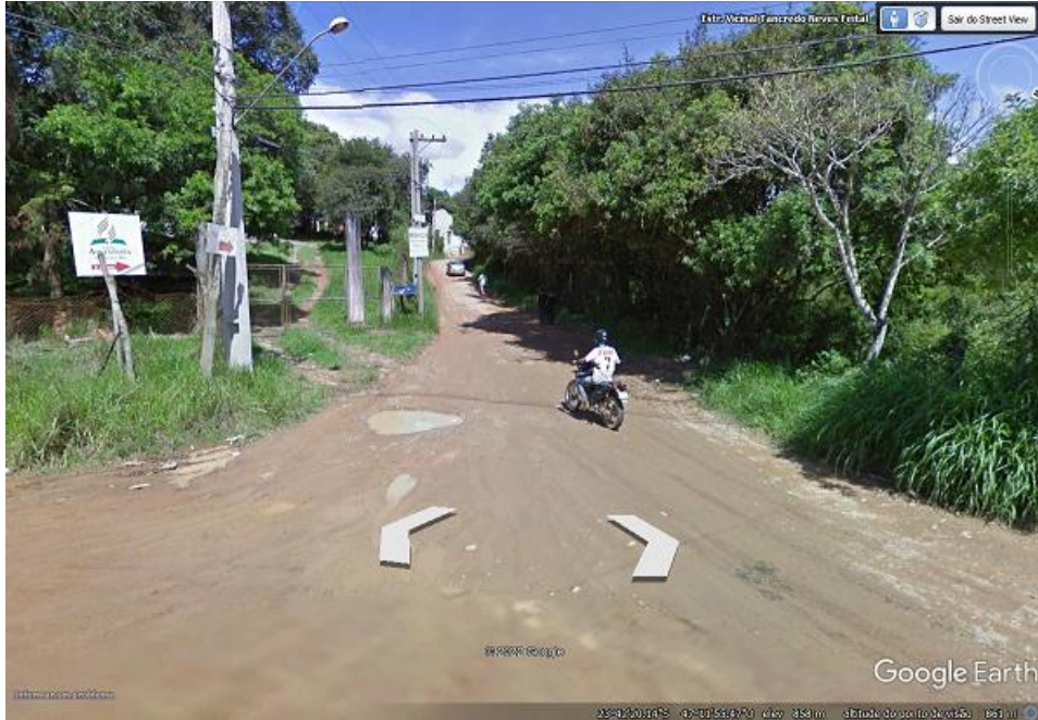
Imagem 4: Entrada do Bairro Tavares. Rua Salvador Barbagallo.