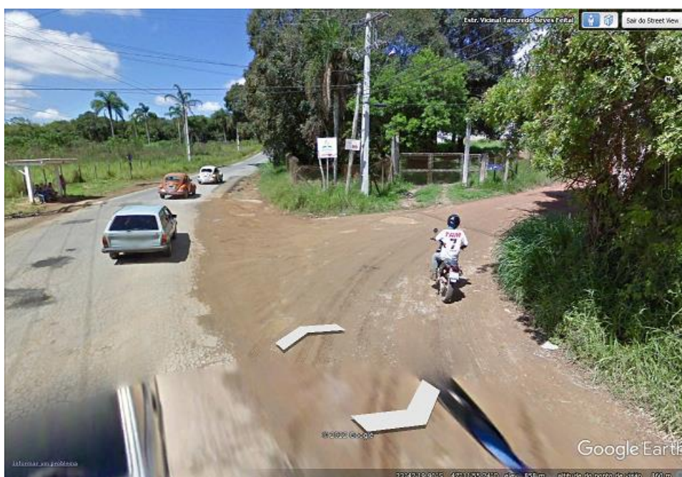
Imagem 3: Estrada Vicinal Tancredo Neves, encontro com Rua Salvador Barbagallo.

As ruas não são pavimentadas. Também não possuem infraestrutura de drenagem de águas pluviais e passeio público. Existe somente fornecimento de energia elétrica.