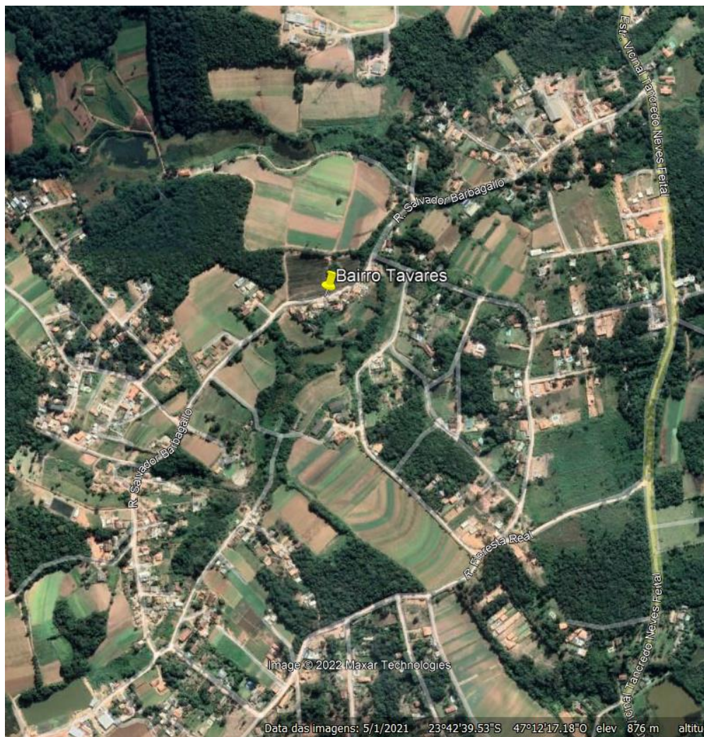
Imagem 2: Visão geral do Bairro Tavares.

Assinado por 1 pessoa: ROBION BERGAMASCO DA SILVA Para verificar a validade das assinaturas, acesse https://assinaturasabesp.1doc.com.br/verificacao/21CC-40B7-B629-7FD6 e informe o código 21CC-40B7-B629-7FD6