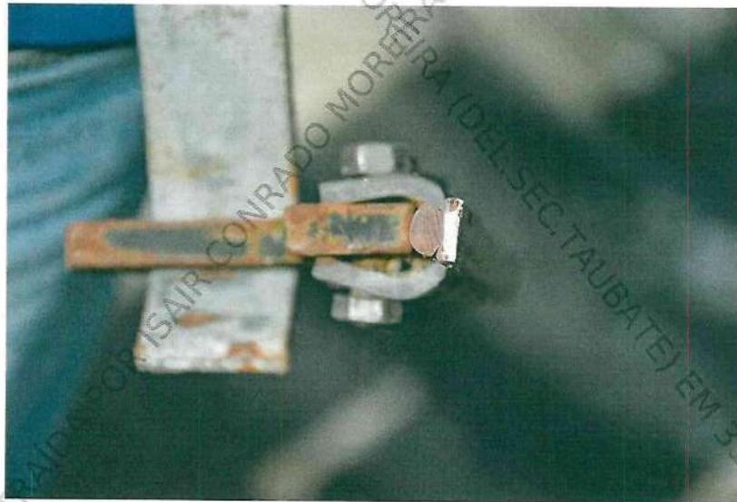
Fotos 6 e 7. Imagens em detalhe da extremidade de porção remanescente de cabo tipo catenária com marcas de corte por instrumento abrasivo - tipo serra .