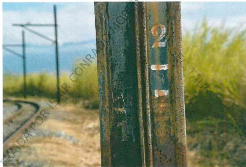
Fotos 3 e 4. Imagens em detalhe das gravações de identificação dos postes – algarismo superior indica a quilometragem do trecho: 2, algarismos inferiores, numeração do poste: 16 e 17.