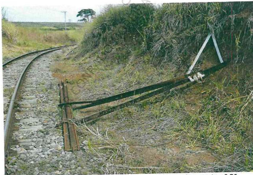
Foto 15. Imagem geral de onde e como encontrado o poste nº 21.