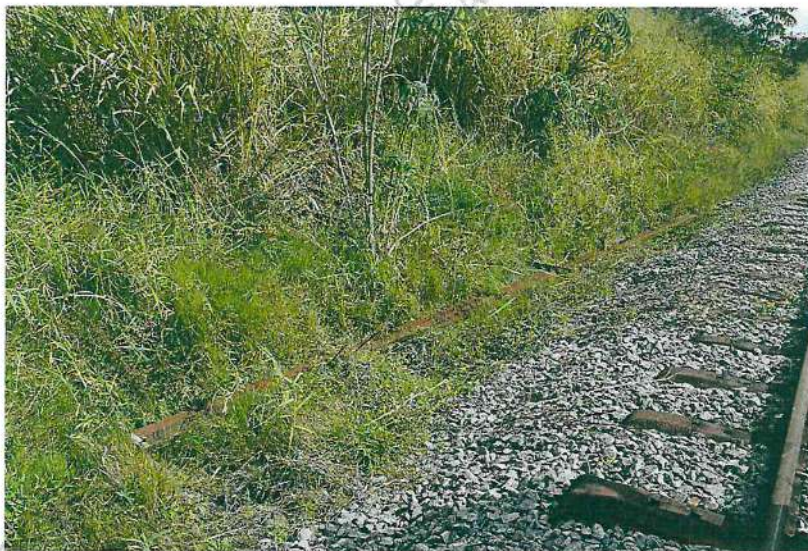
Foto 24. Imagem de onde e como encontrado o poste nº 23 do km 05.