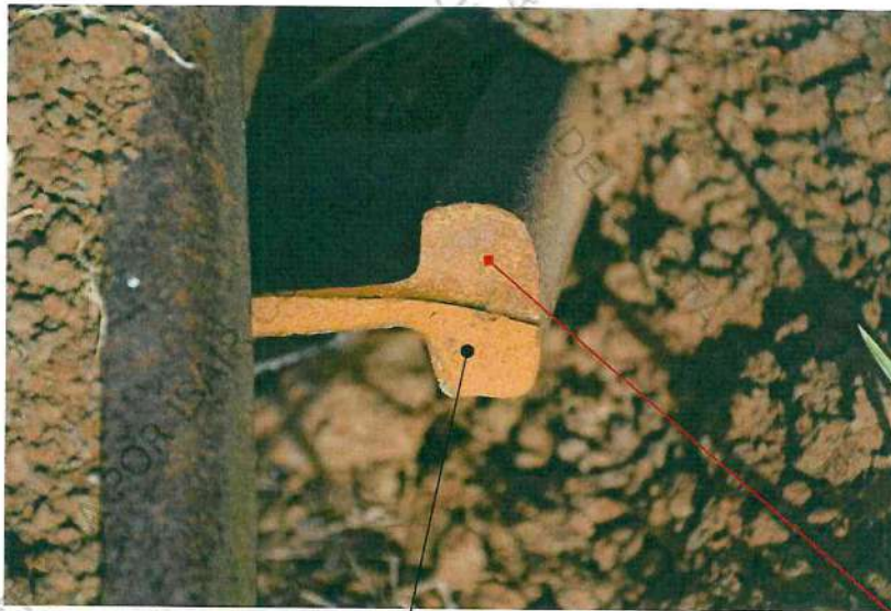
Foto 17. Imagem da marca, de aspecto não recente, oxidada, de danificação por corte parcial na base do poste com fratura total na porção transversal remanescente, ocasionando a secção completa de continuidade transversal na base do poste.