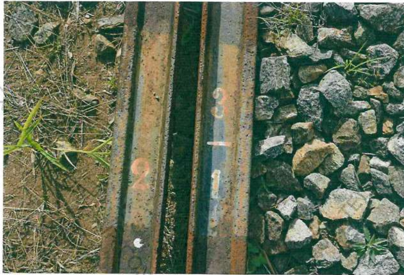
Foto 16. Imagem em detalhe da identificação do poste nº 21 do km 03.