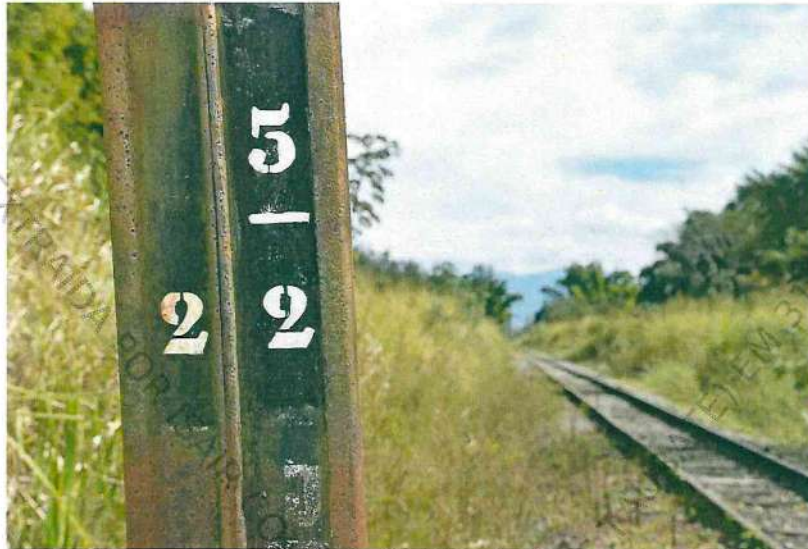
Foto 23. Imagem em detalhe da identificação do poste nº 22 do km 05.