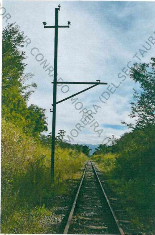
Foto 22. Imagem geral do poste nº 22 no trecho do km 05.