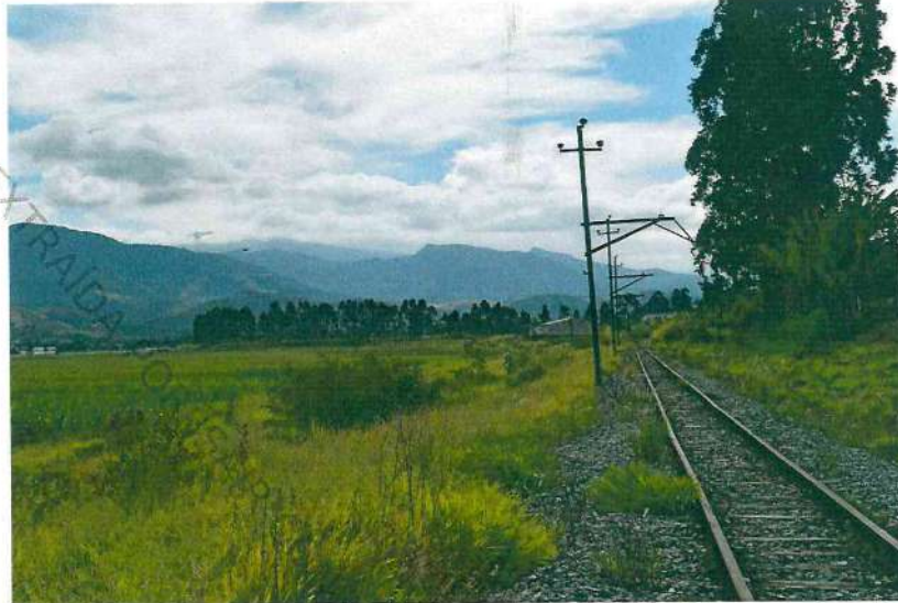
Foto 31. Imagem geral a partir da posição do poste nº 04 do km 08 e captada voltada para o sentido centro-bairro da via férrea.