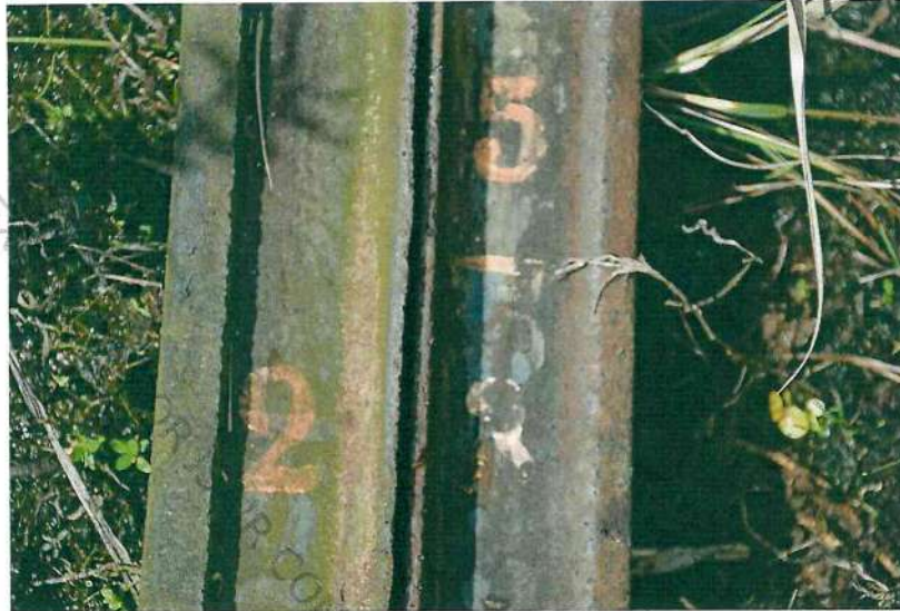
Foto 25. Imagem da identificação, deteriorada, do poste nº 23 do km 05.