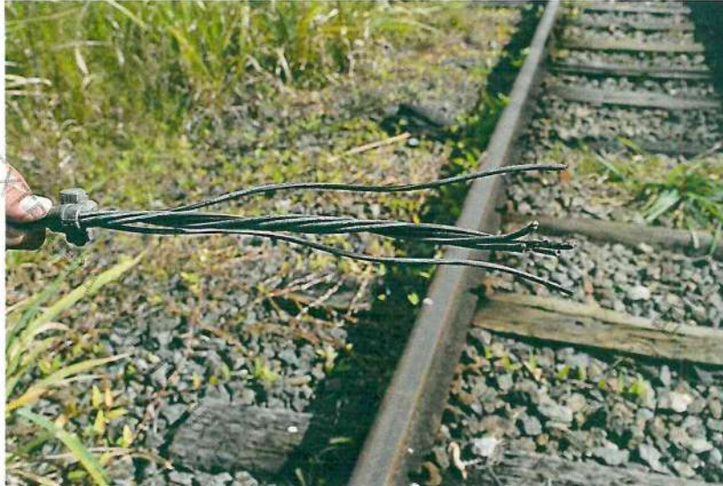
Foto 8. Imagem em detalhe da extremidade de porção remanescente de cabo tipo mensageiro , com marcas de corte por instrumento cortante tipo tesoura ou alicate .