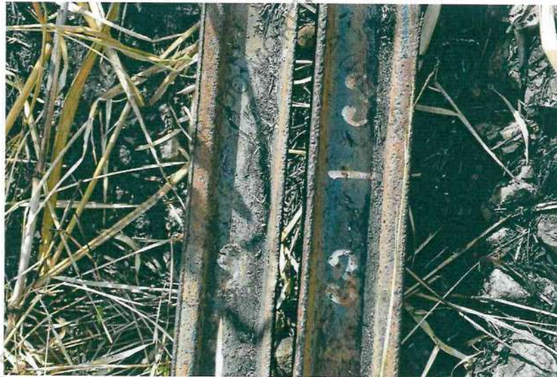
Fotos 20 e 21. Imagens geral de onde e como encontrado e em detalhe da identificação do poste nº 23 do km 03.

DOCUMENTO ASSINADO DIGITALMENTE POR ALESSANDRO NUNES FERIOTTO PIRES NA DATA DE 03/08/2021. PARA MAIORES INFORMAÇÕES SOBRE A AUTENTICIDADE DESTES LAUDO E DE SUA ASSINATURA DIGITAL, ACESSE O SITE WWW.POLICIACIENTIFICA.SP.GOV.BR/LAUDO-DIGITAL/