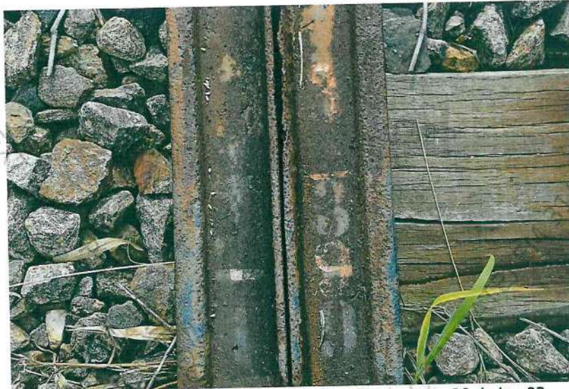
Foto 14. Imagem em detalhe da identificação do poste 19 do km 03.