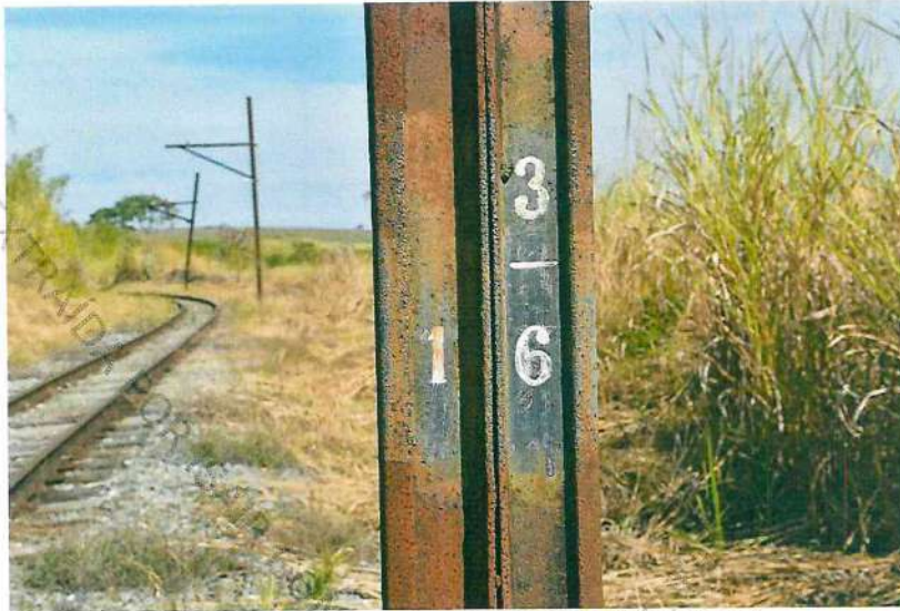
Foto 10. Imagem em detalhe do poste 16 do km 03.