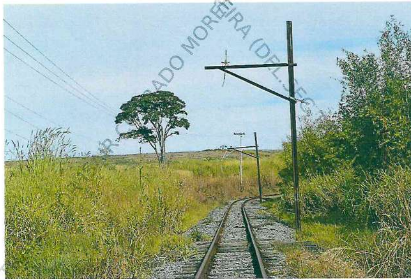
Foto 11. Imagem geral do poste 17 do km 03.