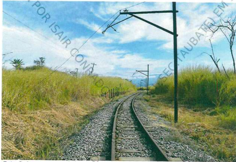
Foto 2. Imagem geral do poste nº 16 do km 02, inicial do trecho periciado.