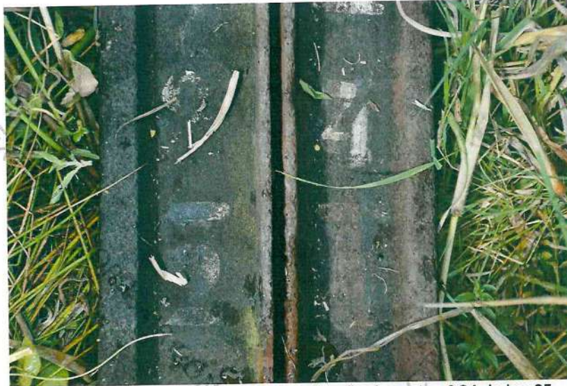
Foto 27. Imagem em detalhe da identificação do poste nº 24 do km 05.