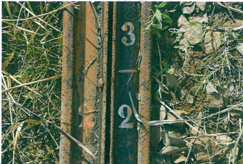
Fotos 18 e 19. Imagens geral de onde e como encontrado e em detalhe da identificação do poste nº 22 do km 03.