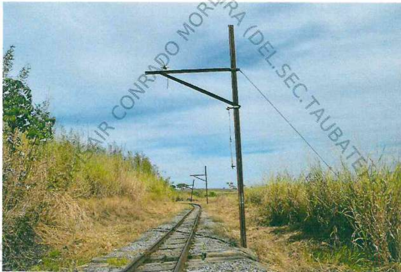
Foto 9. Imagem geral do poste 16 do km.03.