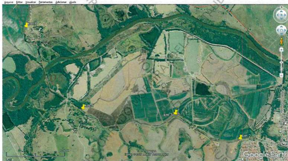
Foto 1. Imagem por satélite do local de interesse pericial, obtida por meio do aplicativo GoogleEarthPro®, acesso na data de 02/8/2021, às 20h00min. Os ícones amarelos indicam os pontos iniciais de cada trecho periciado.

Registrada a ocorrência nos trechos indicados, a Autoridade Policial solicitou a presente perícia.