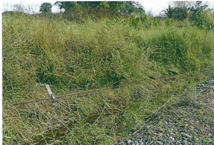
Foto 26. Imagem geral de onde e como encontrado o poste nº 24 do km 05.