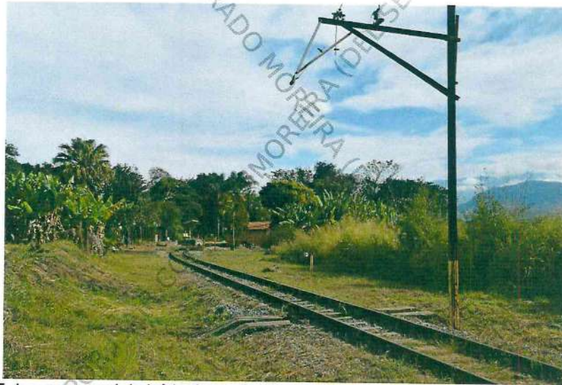
Foto 5. Imagem geral do início do trecho do km 03; na imagem, verifica-se ausência do cabeamento aéreo em trecho inicial do km.03, de aspecto recente, porém não relacionado ao RDO.976/21, tratando-se de novas subtrações.