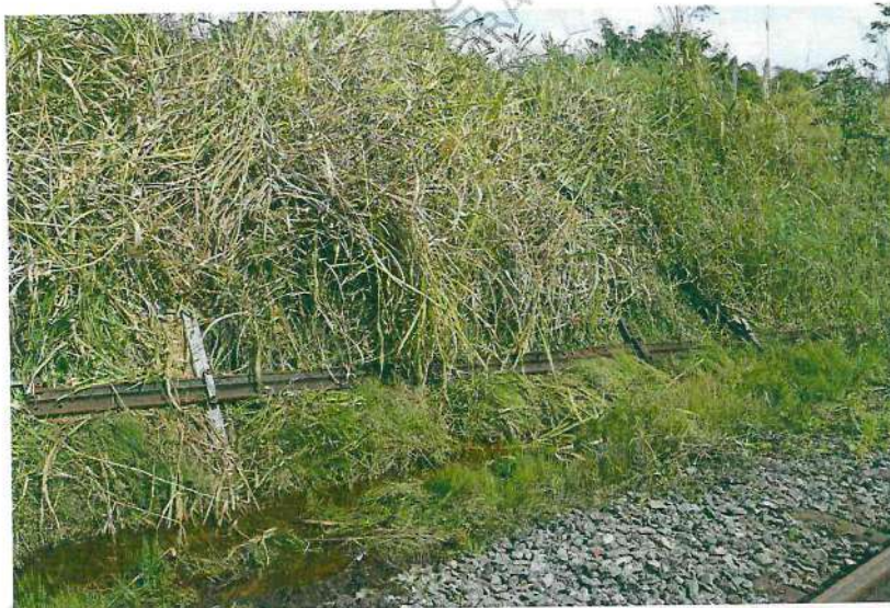
Foto 28. Imagem geral de onde e como encontrado o poste nº 25 do km 05, cuja região onde registrada sua identificação encontrava-se submersa no lodo e água do solo nos arredores da via férrea naquele trecho.