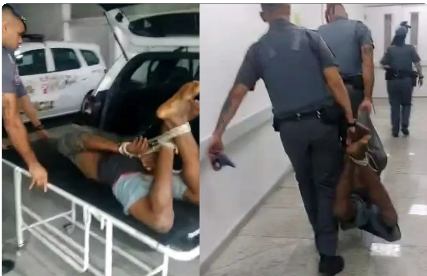
Policiais amarram homem durante abordagem em São Paulo

De acordo com o boletim de ocorrência, o funcionário do mercado contou que três pessoas entraram no comércio na Zona Sul por volta das 23h30 e levaram produtos. O rapaz indicou as roupas dos suspeitos e para onde eles teriam corrido.