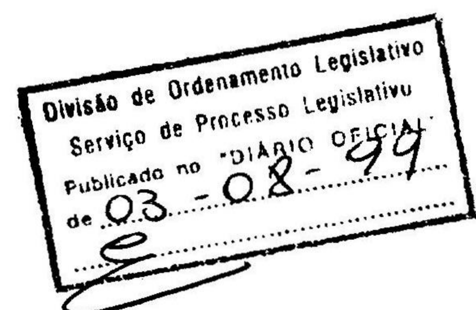
Mário Covas GOVERNADOR DO ESTADO