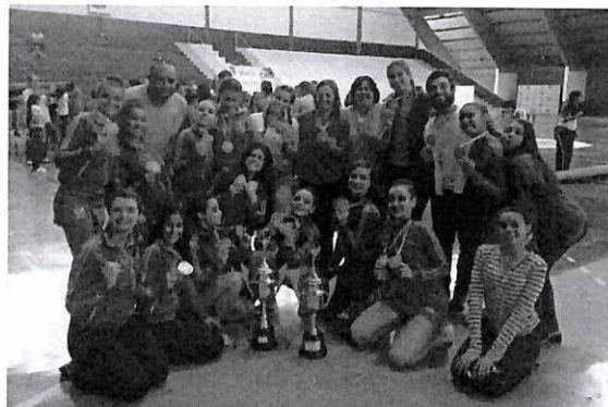
Jogos Regionais 2018