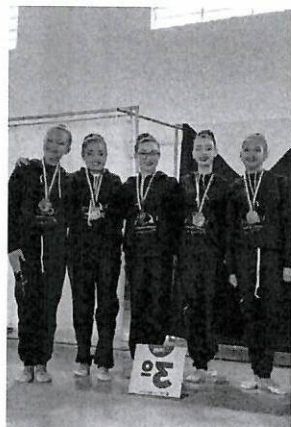
Jogos Regionais 2024 – Tupã