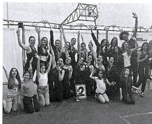
Vice Campeãs - Jogos Regionais 2025 Ourinhos.