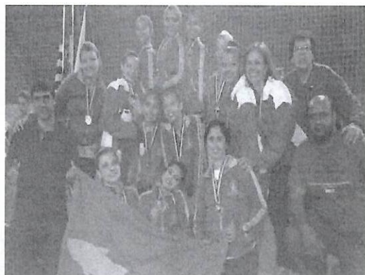
Jogos Regionais 2016 – Osvaldo Cruz