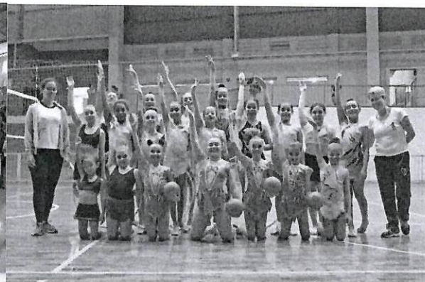
I COPA DE GINÁSTICA RÍTMICA - 2008