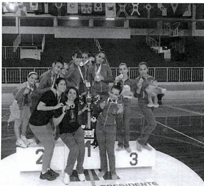
Jogos Regionais 2011 – Presidente Prudente