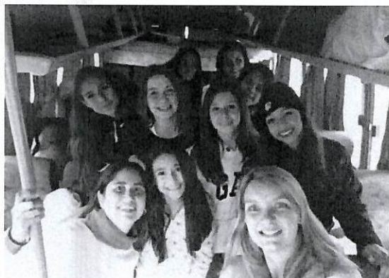
Jogos Regionais 2015 – Osvaldo Cruz.