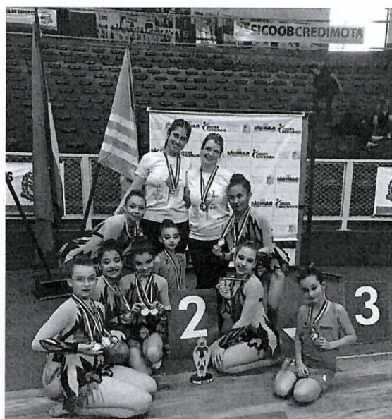
Vice Campeãs - Jogos Regionais 2019 - Assis