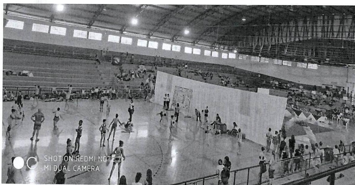
10ª COPA DE GINÁSTICA RÍTMICA 2017

Praça Ataliba Leonel, nº 173 - Centro - Fone: 14 3305-9000