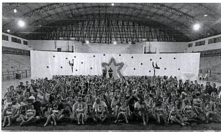
Festival Interno com os Pais de ginastas.

Praça Ataliba Leonel, nº 173 - Centro - Fone: 14 3305-9000