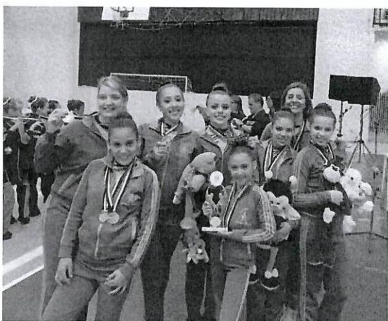
Jogos Regionais 2012 e 2013 – Dracena