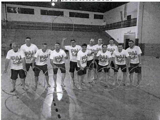
Apresentação dos Pais – Festival 2019