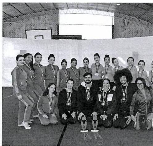
Vice Campeãs - Jogos Regionais 2023 Ourinhos/Santa Cruz do Rio Pardo.