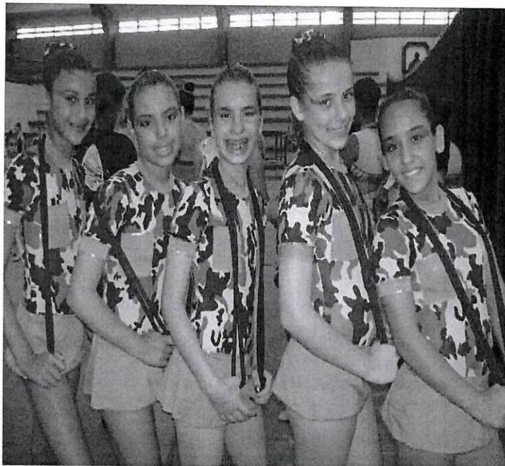
Jogos Regionais 2010 – Assis