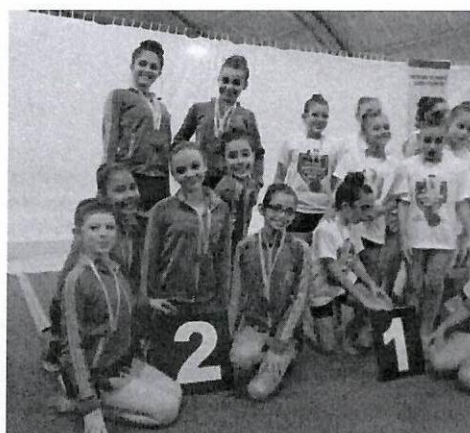
Jogos Regionais 2017 – Presidente Prudente