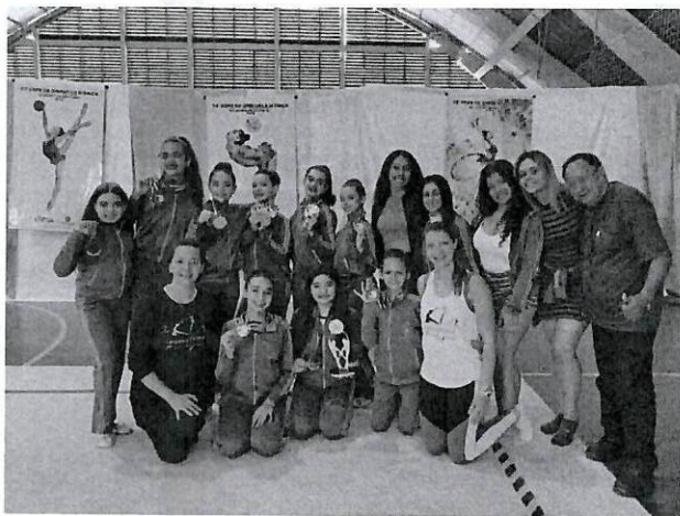
Campeãs - Jogos Regionais 2022 – Assis