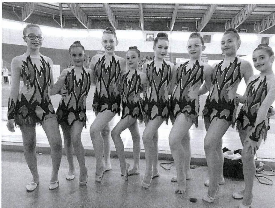
Jogos Abertos 2019