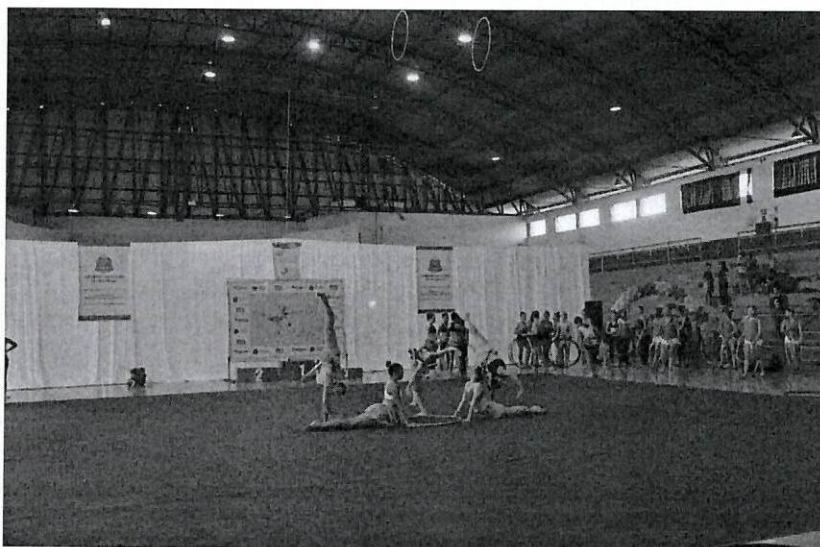
VI COPA DE GINÁSTICA RÍTMICA - 2013

Praça Ataliba Leonel, nº 173 - Centro - Fone: 14 3305-9000