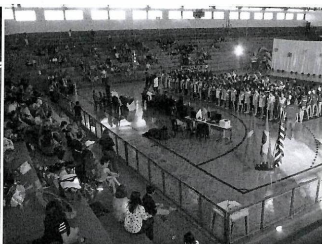
9ª COPA DE GINÁSTICA RÍTMICA 2016