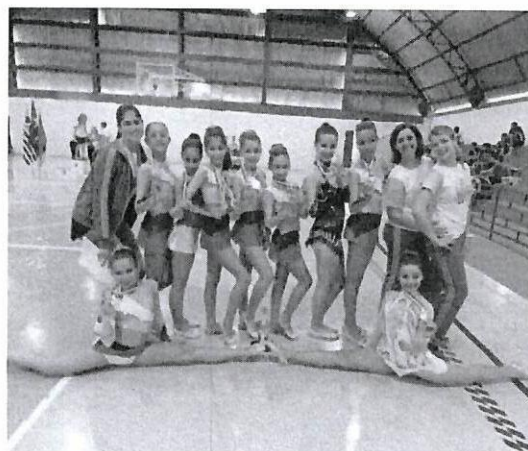
Jogos Regionais 2014 – Marília